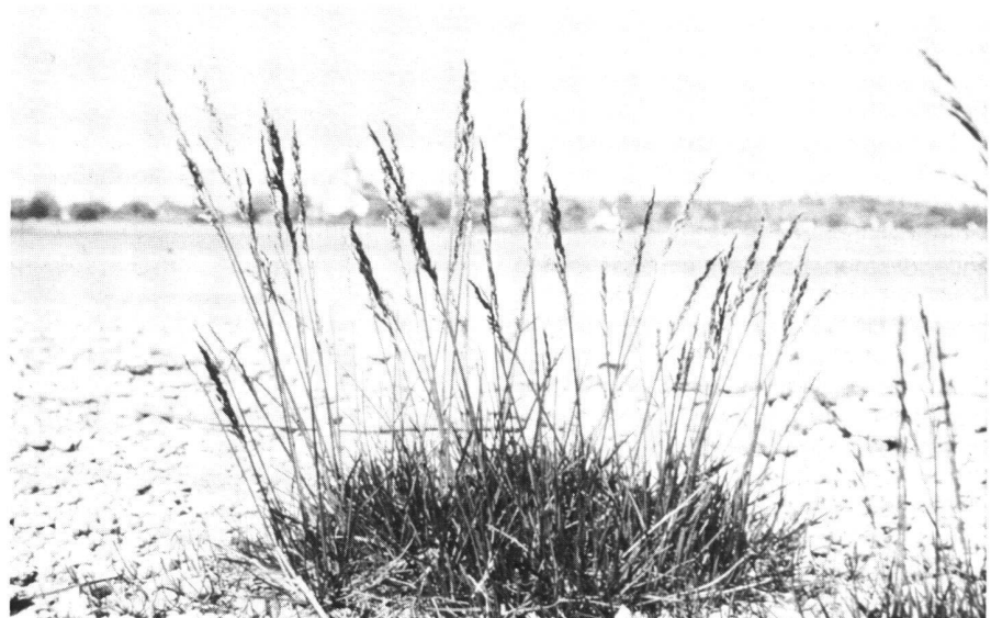
Abb. 1: Die Strandschmiele ist nur am Bodensee heimisch, aber leider sehr stark bedroht.

– von Westen, z.B. entlang der Juraberge oder über das Walenseegebiet durch das Rheintal an den See