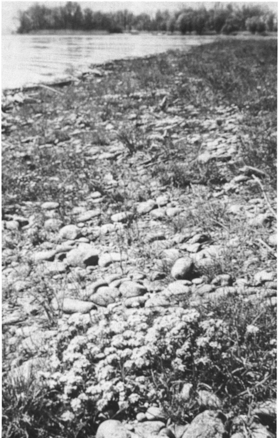
Abb. 2: Strandrasen am Bodensee. Karger Lebensraum für seltene Tiere und Pflanzen.

Ist Ihnen auch schon aufgefallen, dass am Bodensee die dem Schilfgürtel normaler-