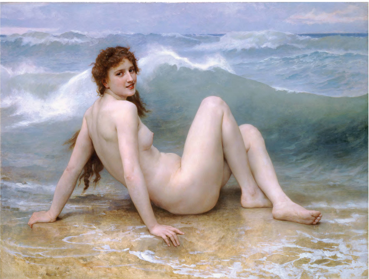
5 William-Adolphe Bouguereau (La Rochelle, 1825-1905), La Vague , 1896. Huile sur toile, 121 x 160,5 cm. Collection privée.