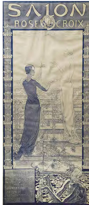
8 Carlos Schwabe, Spleen et Idéal , 1907. Technique mixte, 28 x 20,5 cm. Collection privée.