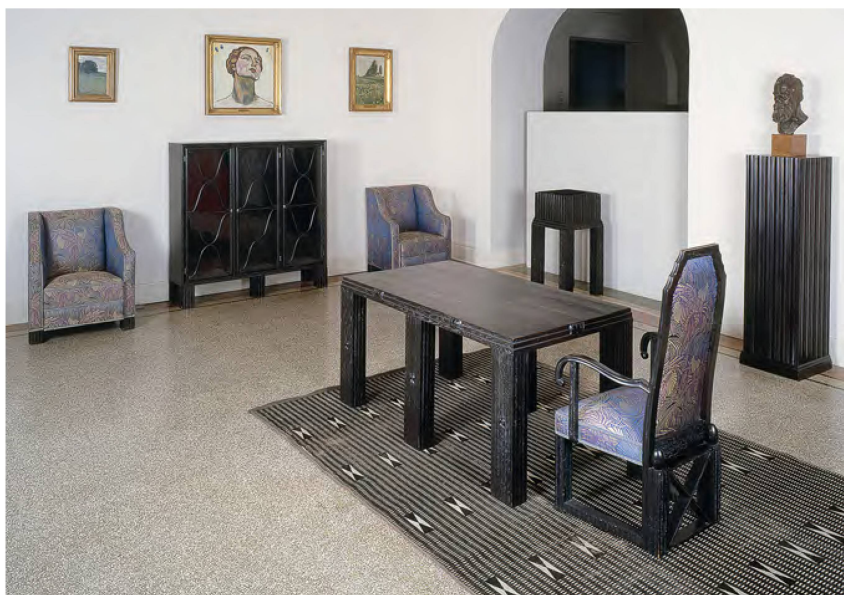
4 Exposition du mobilier Hoffmann (MAH, 1990). Grande table, deux chaises à bras, deux fauteuils, sellette, bibliothèque basse, jardinière sans son bac. Coll. MAH.