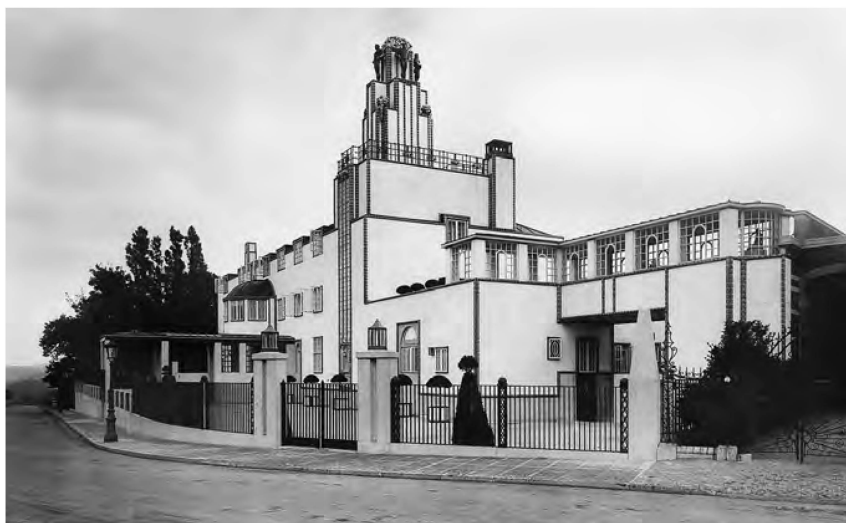
2 Palais Stoclet à Bruxelles (1904-1911).

En 1903, il fonde avec Koloman Moser une nouvelle association, la Wiener Werkstätte, qui rassemble de nombreux métiers liés à l'architecture, la décoration, la mode, le design, et où les arts appliqués viennois vont véritablement