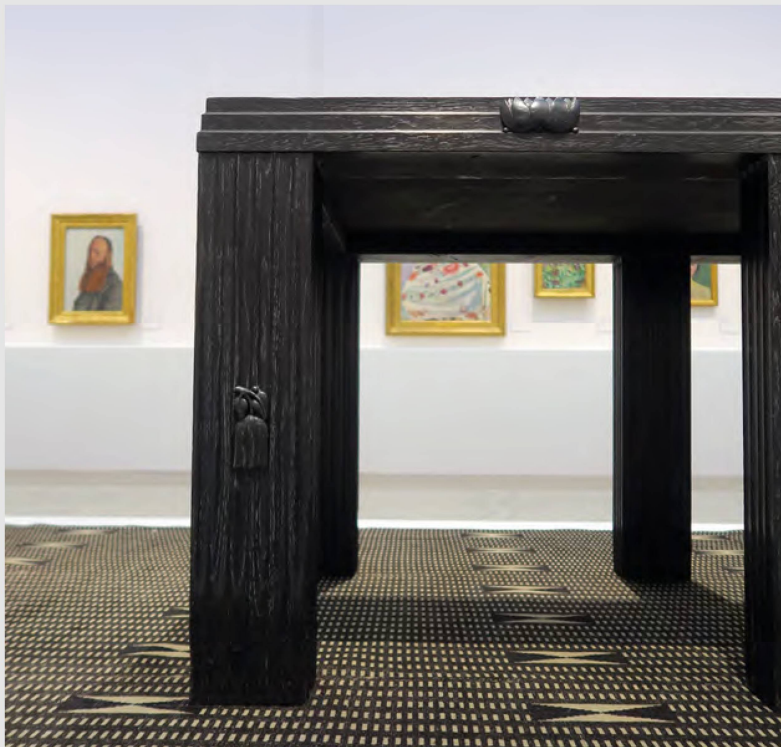
1 Détail de la grande table du salon de l'appartement de Ferdinand Hodler dans l'exposition Hodler intime (MAH, 2018). Mobilier conçu par l'architecte Josef Hoffmann. Coll. MAH.

LE MUSÉE D'ART ET D'HISTOIRE DE GENÈVE POSSÈDE PLUSIEURS PIÈCES DE MOBILIER DE L'APPARTEMENT SITUÉ AU 29, QUAI DU MONT-BLANC À GENÈVE, OÙ FERDINAND HODLER EMMÉNAGEA AVEC SA FEMME EN 1913, ET OÙ IL VIVRA JUSQU'À SA MORT EN 1918. CE MOBILIER FUT CONÇU, SUR COMMANDE DU PEINTRE, PAR L'ARCHITECTE ET DÉCORATEUR VIENNOIS JOSEF HOFFMANN (1870-1956), QUI RÉALISA AU DÉBUT DU XX e SIÈCLE PLUSIEURS AMÉNAGEMENTS INTÉRIEURS POUR DES PERSONNALITÉS ISSUES DU MONDE ARTISTIQUE OU DE LA GRANDE BOURGEOISIE.