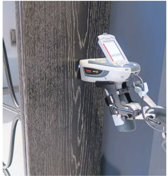
13 Analyse de la céruse de la bibliothèque vitrée avec le spectromètre de fluorescence X. MAH, inv. AD 3731.

La fabrication simple et robuste de ce mobilier a limité jusqu'ici les risques de détériorations structurelles. Il existe en revanche une fragilité de surface au niveau des bords, aux arêtes souvent vives, inhérente à l'utilisation du chêne. Ce bois est friable sur les angles à cause de ses pores très marqués, et doit donc être manipulé avec précaution. Le dépoussiérage est particulièrement délicat à opérer pour ne pas accrocher et arracher les fibres. Ces dégâts pourraient à tort être considérés comme minimes, mais la répétition des opérations finit par entraîner des détériorations qui vont aller en s'aggravant et seront d'autant plus visibles que la couleur claire du chêne naturel apparaît sous la laque noire. |