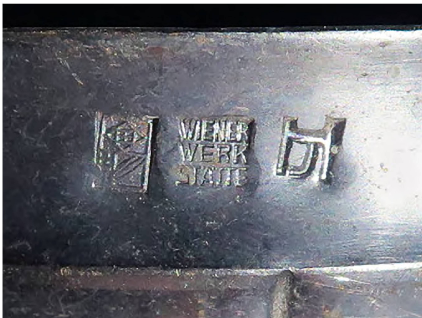
12 Détail du lustre : à gauche, poinçon de la marque déposée Wiener Werkstätte; au centre, monogramme de la Wiener Werkstätte; à droite, poinçon de Josef Hoffmann. MAH, inv. AD 3747.

Ceci amène à parler de manière plus générale de l'influence du Japon dans le mobilier de Hoffmann, dans lequel on retrouve « l'accentuation de la verticalité », « des formes épurées en lesquelles les vides l'emportent sur les pleins » 3 . Les croisillons sur l'arrière des chaises du salon (fig. 3) et ceux des jardinières basses (fig. 4) font référence au treillis, élément du répertoire décoratif asiatique qui n'apparaissait pas de façon aussi voyante dans les styles occidentaux avant l'influence du japonisme dans l'Art Nouveau. Les accoudoirs arqués de ces sièges sont également très proches de ce que l'on peut trouver sur le mobilier asiatique. Les deux lustres que le musée possède dénotent, quant à eux, une influence Jugendstil marquée, avec des lignes courbes et un décor végétal sinueux très en évidence, mais toujours avec une recherche de grande simplicité. Ces lampes sont marquées sur la face visible de leur base d'accroche du monogramme et du poinçon de la marque déposée de la Wiener Werkstätte, ainsi que du poinçon de Josef Hoffmann (fig. 12).