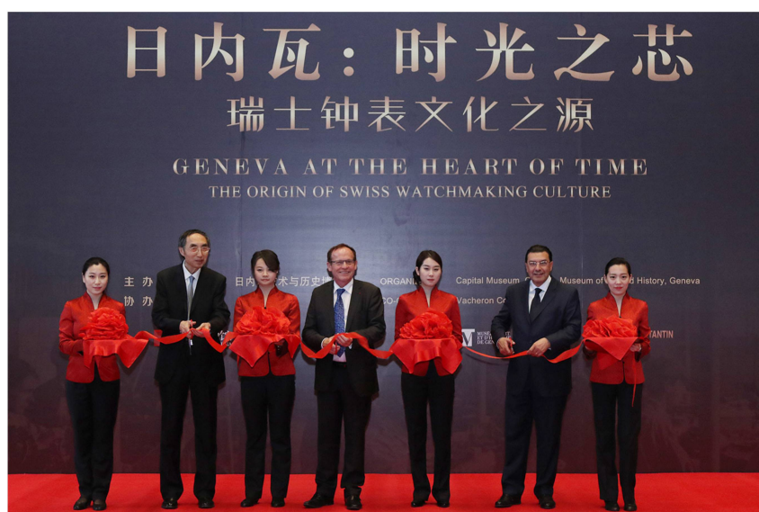
2 Inauguration officielle de l'exposition Geneva at the Heart of Time , 24 avril 2015, Capital Museum, Pékin.

Autre exemple, la directrice du Musée de l'Élysée à Lausanne qui pose dans son chalet suisse pour le maroquinier italien Tod's. Ces photos ont été publiées dans le magazine de la marque et largement relayées sur Internet. On constate