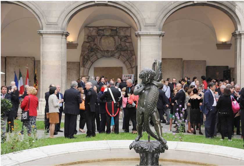
7 Fête nationale italienne célébrée dans la cour du Musée d'art et d'histoire, juin 2014.

Les notions de bénéfice, de fréquentation, d'investissement permettent à présent de mesurer la gestion plus ou moins efficace des musées ainsi que d'évaluer le succès de leurs projets. Le mécénat entre bien évidemment dans cette équation. Il peut être de compétence, technologique, en nature, mais la forme la plus fréquente est certainement le mécénat financier. Fondations, entreprises, particuliers participent à la réalisation d'opérations ponctuelles, telles qu'expositions, restaurations d'œuvres ou projets de médiation. Les partenariats public-privé soutiennent aussi de façon récurrente la construction de nouveaux musées ou des travaux d'agrandissement. La Suisse est un exemple saisissant de ce dernier cas de figure (fig. 5 et 6).