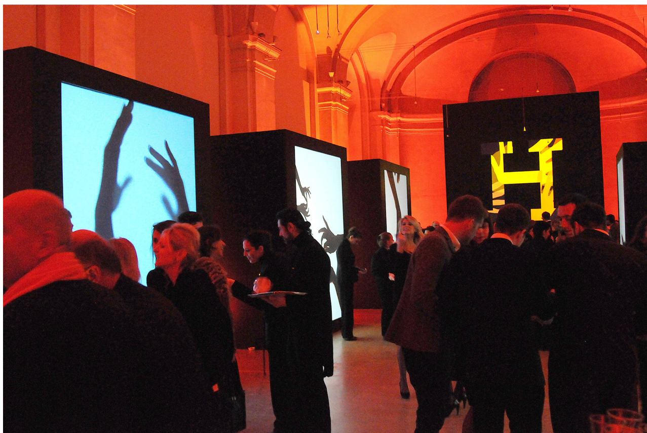
3 Réception Hermès au Musée d'art et d'histoire, 29 novembre 2011.

que les acteurs des milieux artistiques sont de plus en plus nombreux à associer leur image à celle d'une marque pour promouvoir leur institution.