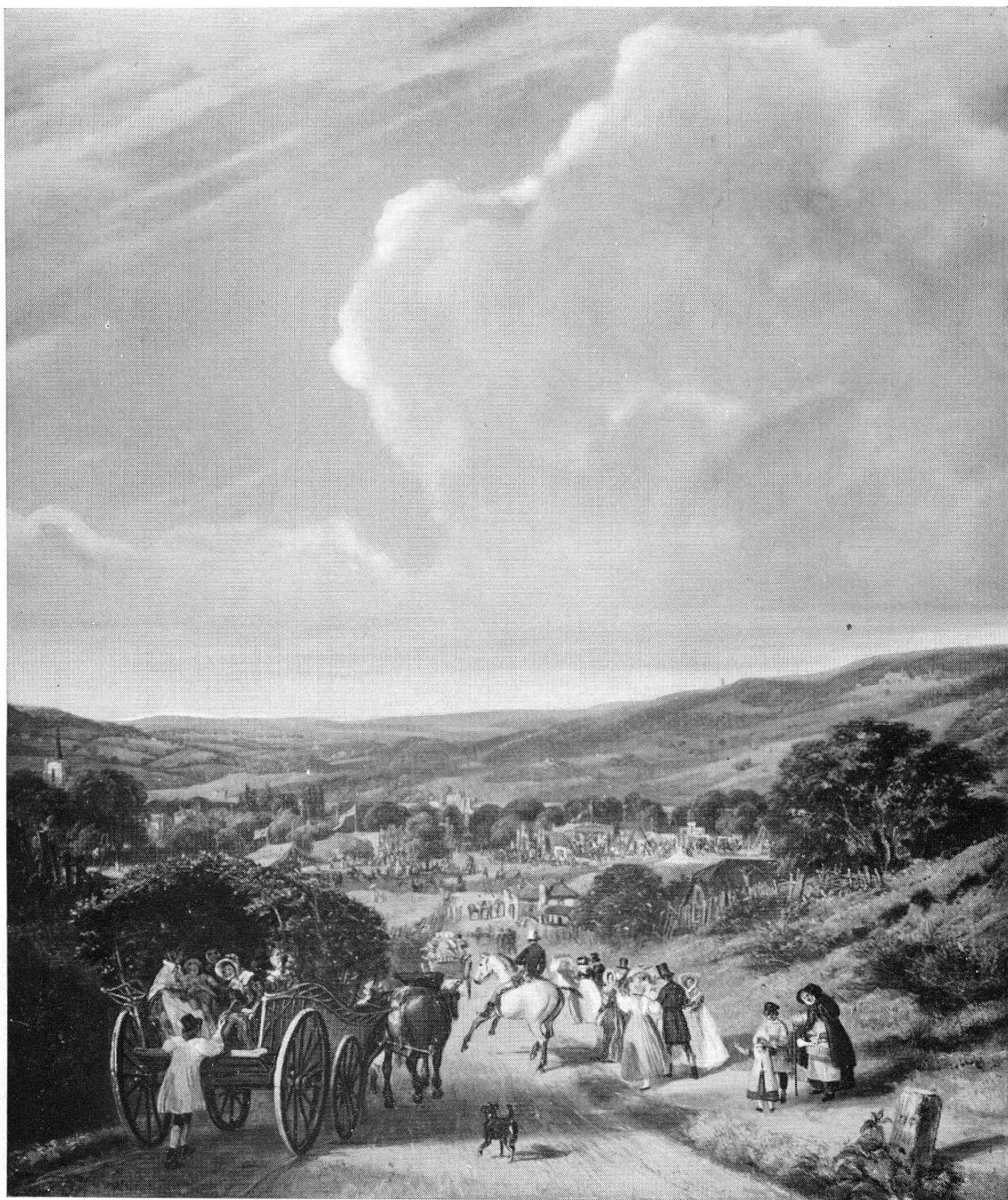
PL. IV. — J.-J. Chalon, Fête foraine. — Musée de Genève.