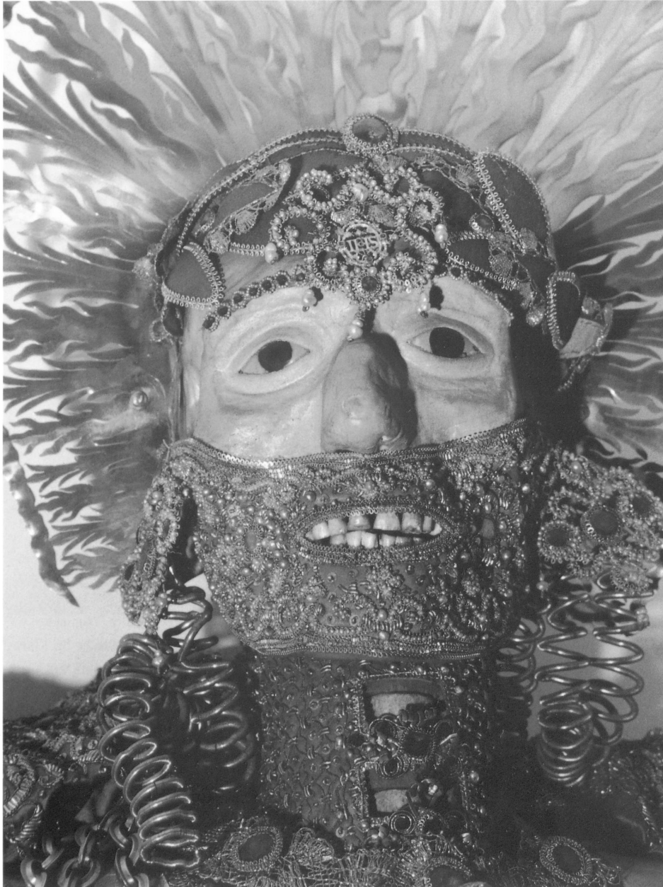
Abb. 7: Detail von Abb. 5.