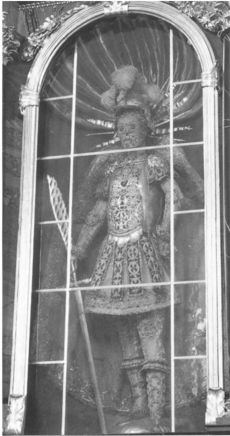
Abb. 4: Prosper in der Klosterkirche St. Klara in Stans NW, gefasst um 1675. Abb. 5: Pius im Kloster Maria Opferung in Zug, gefasst kurz nach 1676.