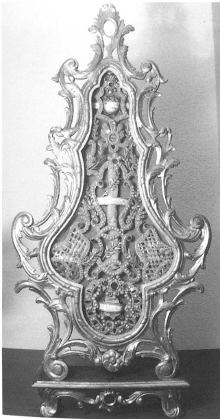
Abb. 14: Reliquiar in der Sakristei der ehem. Klosterkirche Gnadenthal AG, zweites Viertel 18. Jh. Abb. 15: Castorius in der Pfarrkirche Rohrdorf AG, gefasst um 1755.