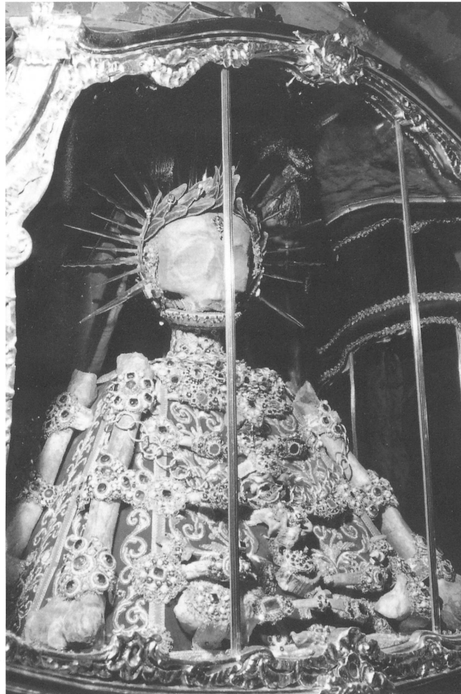
Abb. 3: Synesius in der Pfarrkirche Bremgarten AG, Neufassung entstanden um 1753.