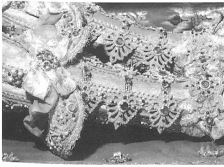
Abb. 10: Detail von Abb. 8. Abb. 11: Detail von Abb. 2.