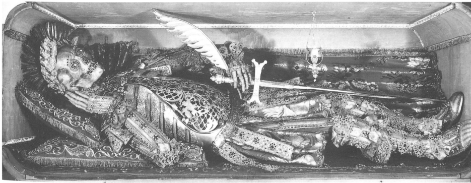
Abb 8: Coelestin in der Franziskanerkirche Luzern, gefasst um 1736.

des bekleideten Skelettes stärker (Abb. 8). 22 Der Schädel mit bleckenden Zähnen und maskenhaft angedeuteten Augen und Nase erscheint als Kopf mit lebendigen Gesichtszügen (Abb. 9). In der Kleidung ist das römische Vorbild frei umgestaltet: Bestickte Stoffbahnen ersetzen die metallene Panzerung an den Extremitäten, die Stiefel samt Schnallen bestehen aus textilen Materialien (Abb. 10). Trotz der Unterschiede weist das Gestaltungskonzept für die Reliquienstatuen aus Zug und Stans Ähnlichkeiten auf: Der römische Märtyrer wird wie ein Mensch bekleidet und durch sein Kostüm als miles christi definiert. Die Gebeine sind in ein lebensnahes, plastisches Abbild des Heiligen integriert. Diese Form der Fassung war weit verbreitet und beschränkte sich nicht auf die Klöster in Zug und Stans. 23