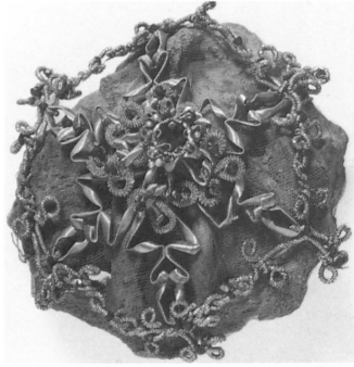
Abb. 12: Detail der Vitalis-Fassung in der Stiftskirche Beromünster AG, entstanden um 1650. Abb. 13: Leontius in der Klosterkirche Muri AG, Stickereien entstanden um 1647.