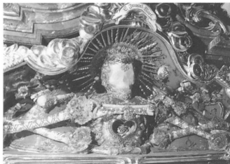
Abb. 1: Vitalis in der Stiftskirche Beromünster LU, gefasst um 1650.