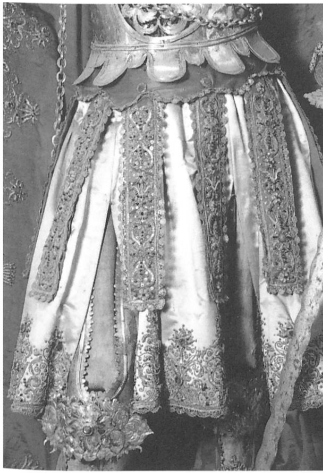
Abb. 6: Detail von Abb. 5.

Umsetzung sei durch italienische Vorbilder ausgelöst worden, und er vermutet, dass der eigentliche Anstoss zur Ganzkörperfassung von Vitalis aus der Romreise eines Einsiedler Paters hervorging. 12 Für Italien sind verschiedene mumifizierte und bekleidete Heiligenkörper bekannt, die auch in zeitgenössischen Reisebeschreibungen erwähnt wurden. 13 Die Fassungen der Katakombenheiligen scheinen jedoch nur vereinzelt auf solche Mumien zurückzugehen. 14 Meist handelt es sich um gefasste Skelette oder bekleidete Statuen mit sichtbar eingelegten Gebeinen, die in keiner Weise einen mumifizierten Körper vorzugeben versuchen.