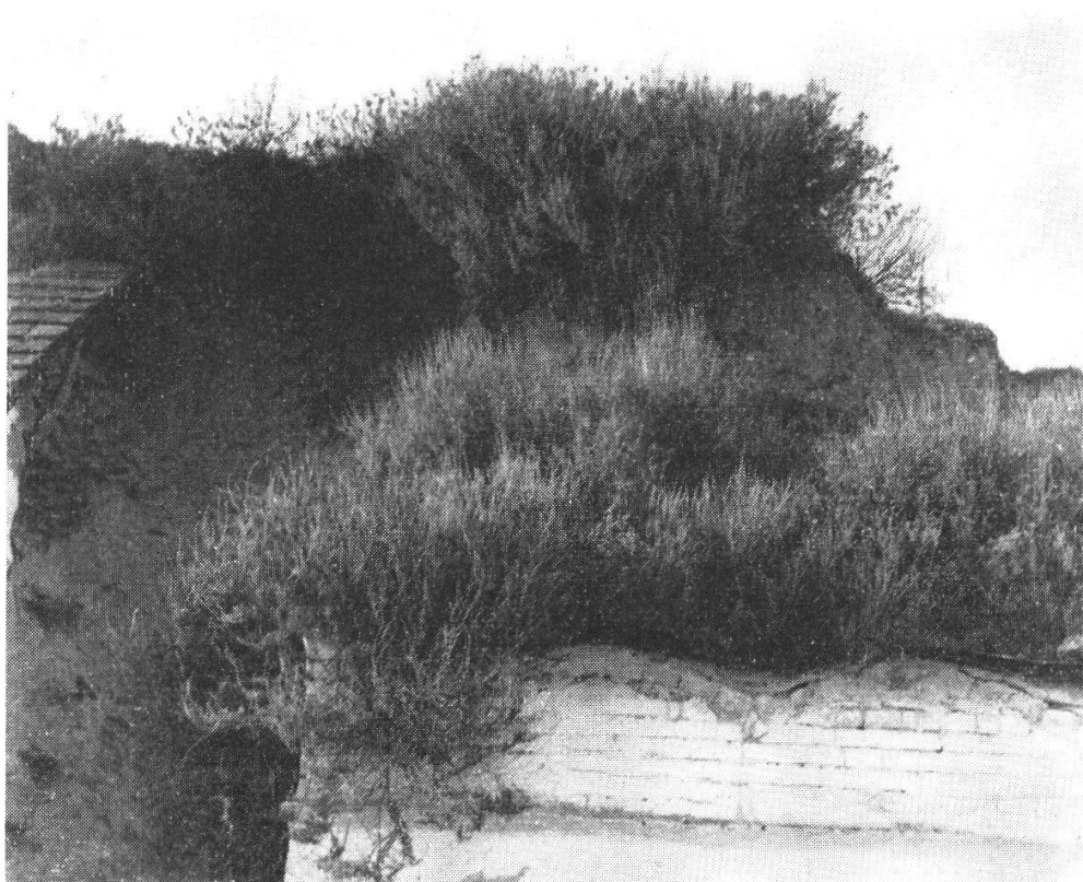
Abb. 4. Eurotia ceratoides über Weinkellern in einem «Kellergassel» von Goggendorf (Weinviertel, Niederösterreich).

haben auch Kaninchen (auf dem Steilhang des Eurotia -Vorkommens bei Schoderlee) durch ihre Baue inmitten des Hanges stets von neuem offene Standorte geschaffen und dadurch ein sekundäres Eindringen von Eurotia von der Oberkante her auf die Hangfläche bewirkt.