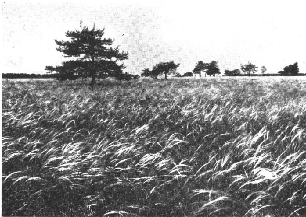
Abb. 1. Federgrasflur (Sand-Rasensteppe) mit gepflanzten Föhren in der Weikendorfer Remise (Marchfeld, Niederösterreich).

u. a. das Vorkommen von Daphne cneorum in der Sand-Rasensteppe des Marchfeldes, ein wichtiges und auch vegetationskundlich interessantes Vorkommen: vgl. WENDELBERGER 1954). Physiognomisch auffallend ist das Federgras (Abb. 1); natürliche Holzarten fehlen noch. Diese Gesellschaft ist identisch mit dem Festucetum sulcatae der ungarischen Autoren.