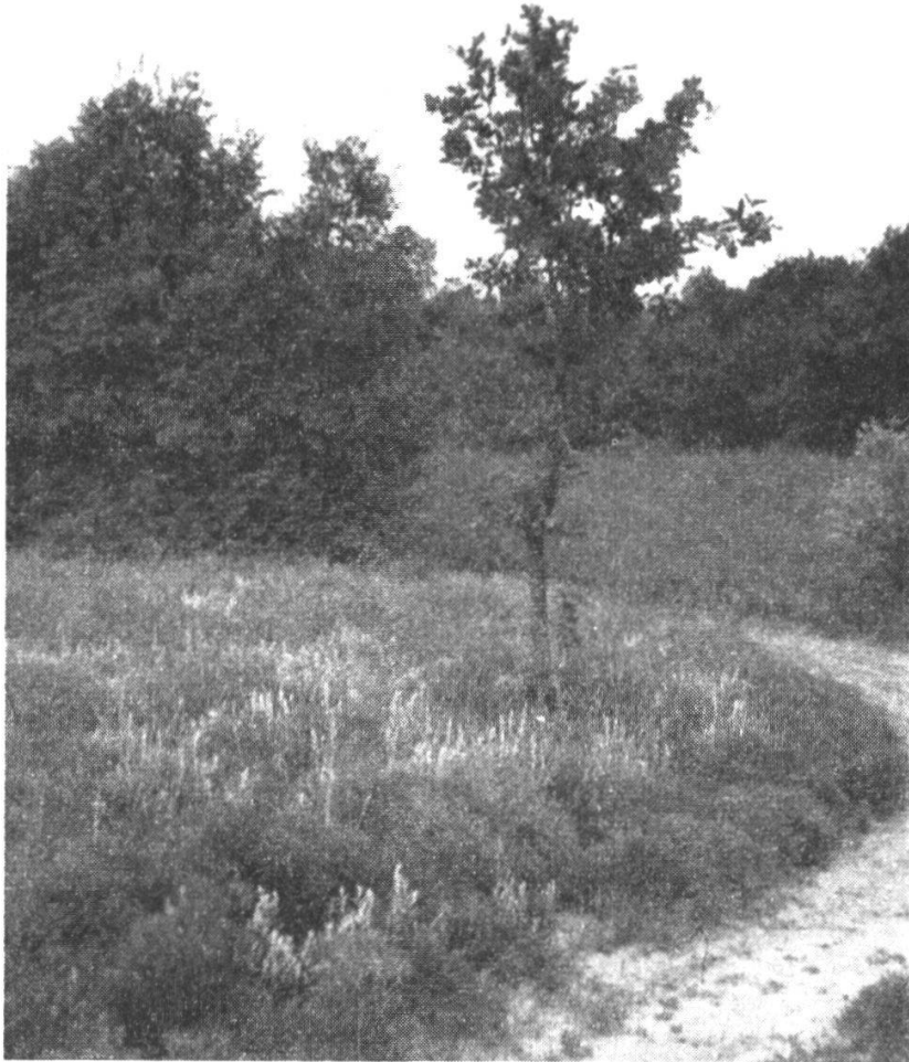
Abb. 3. Letzter Rest einer Alkali-Waldsteppe in Niederösterreich (bei Baumgarten/March) mit Aster canus und einzelner Quercus Robur .

Eichenwaldes, der unmittelbar angrenzend, jenseits des Hochwasserdammes, noch in gutem Zustand erhalten geblieben ist (Abb. 3).