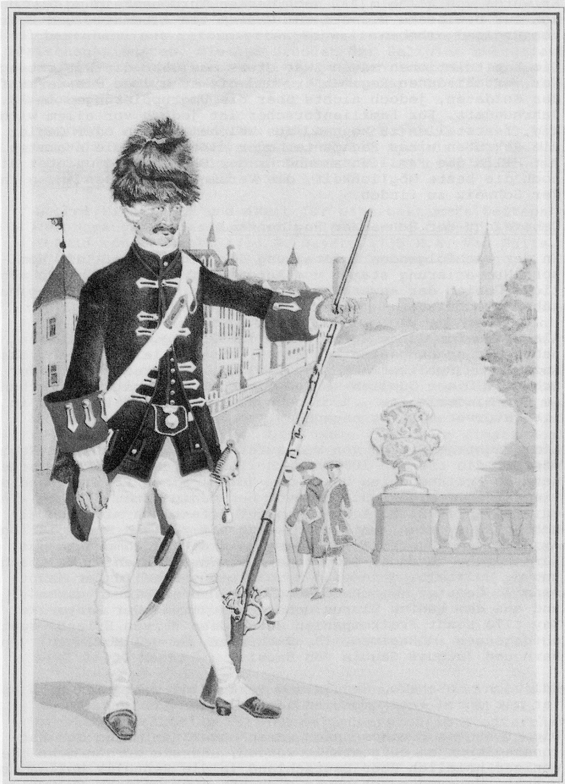
Grenadier Garde Regiment (XIII) 1753