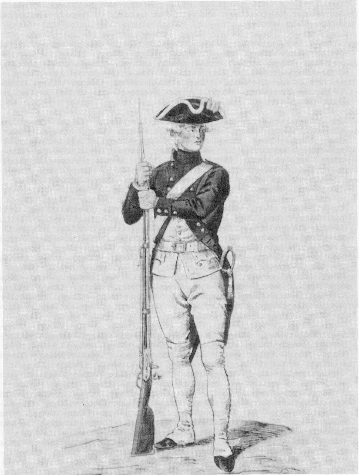
Füsilier des Regiments de Goumcøns (II) 1787, Schweiz. Landesbibliothek Bern