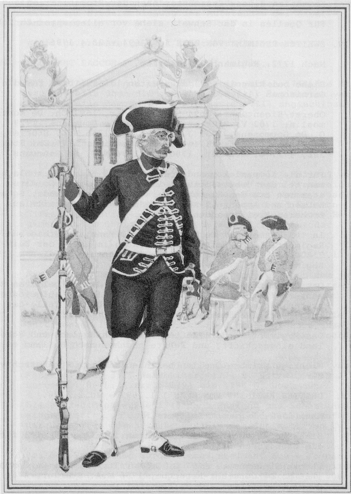
Füsilier Garde Regiment (XIII) 1773