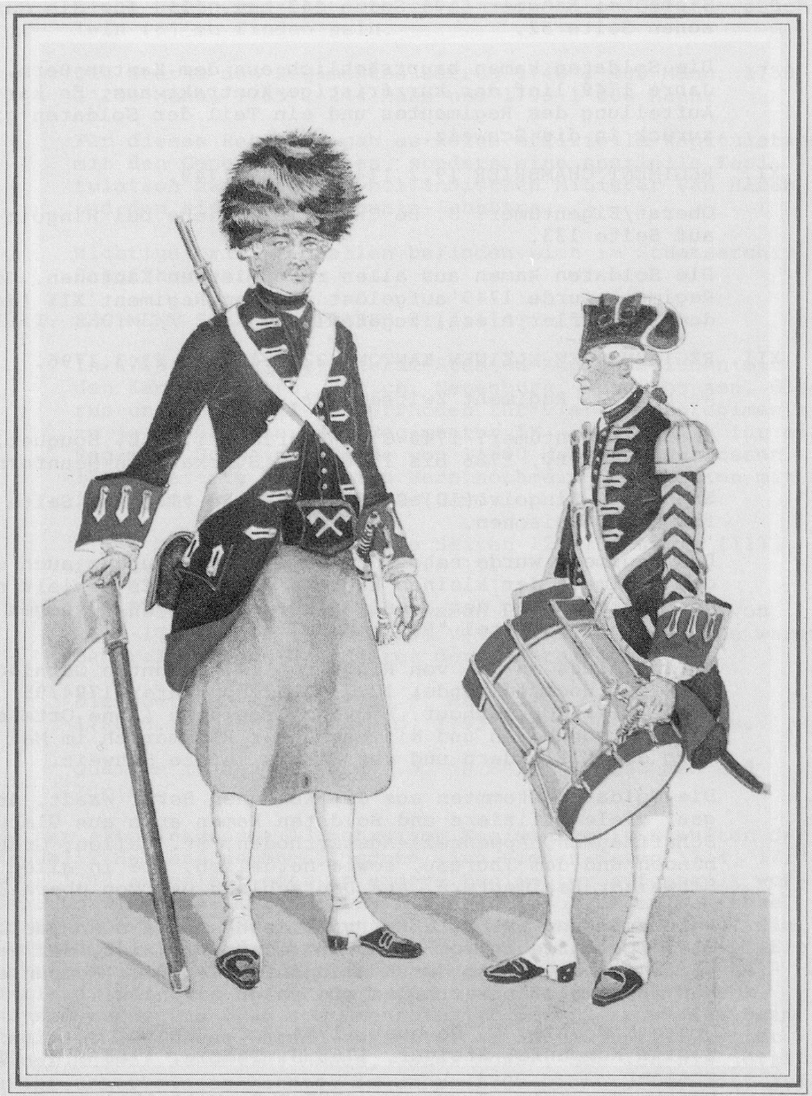
Zimmermann und Tambour Garde Regiment (XIII) 1753, Schweiz. Landesbibliothek Bern