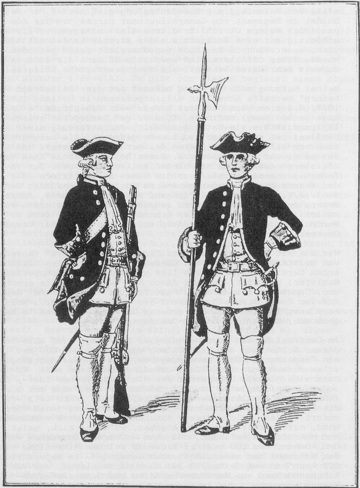
Füsilier und Unteroffizier Regiment Hirzel (VII) 1725