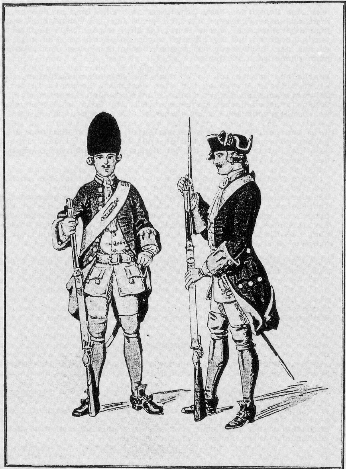
Grenadier und Füsilier Regiment Hirzel (VII) 1725