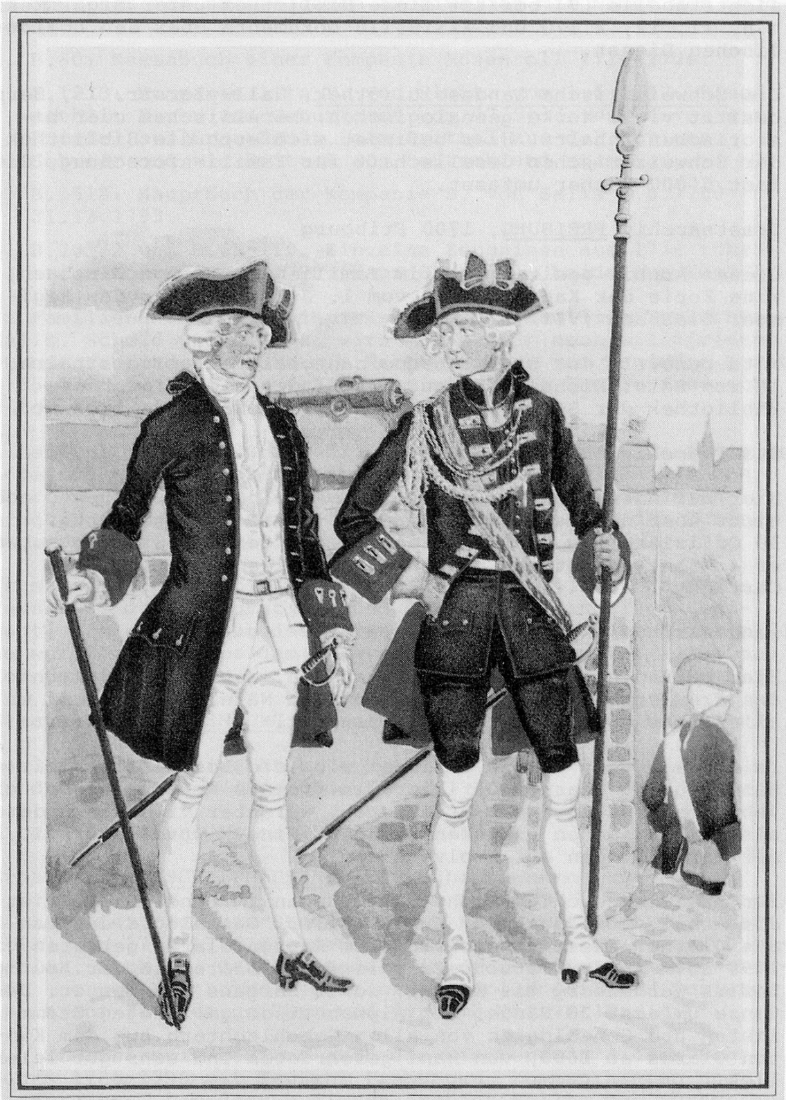
Offiziere Regiment Hirzel (VII) 1753, Schweiz. Landesmuseum Zürich