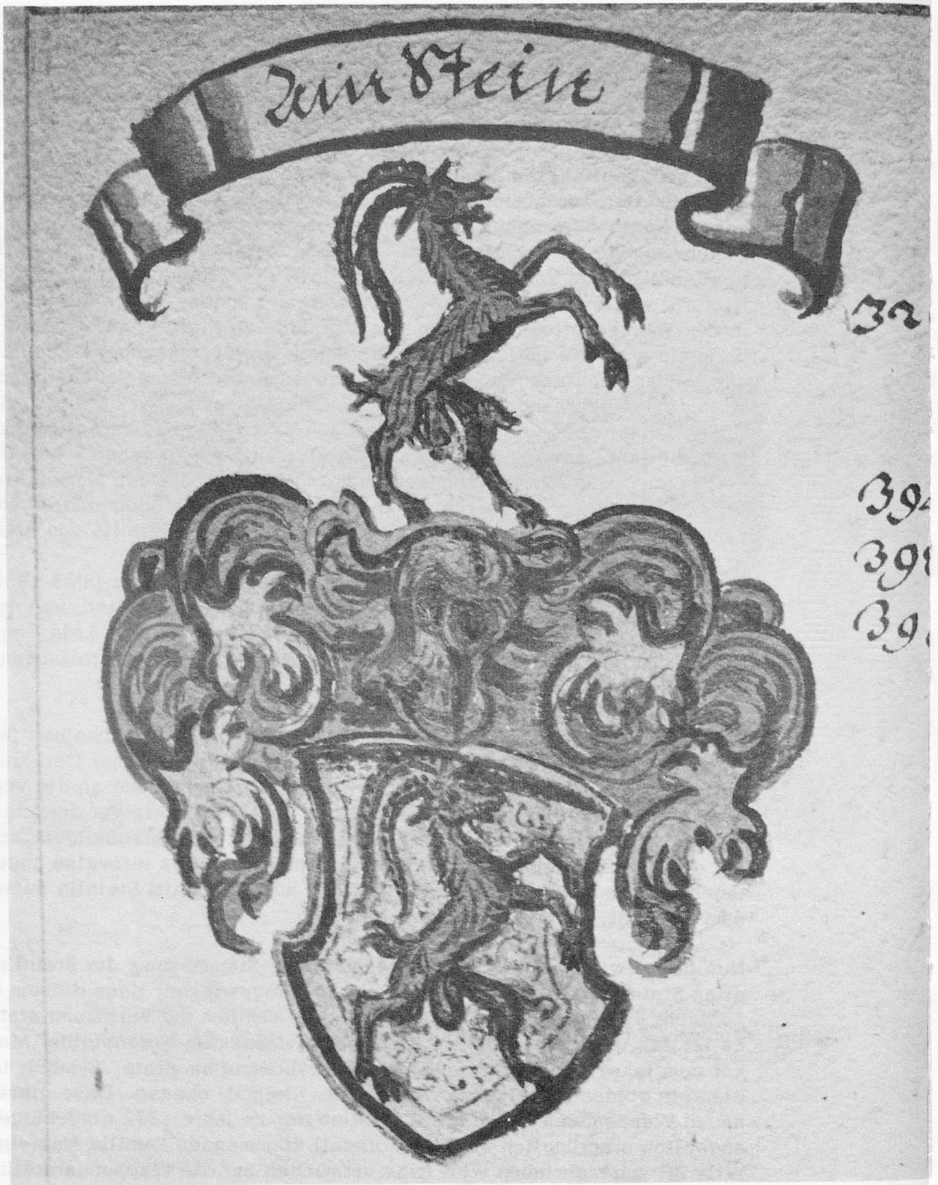
Wappen der Am Stain von St. Gallen 1454 Notensteiner Matrikel von Junker Laurenz Zily 1637, Vadiana St. Gallen