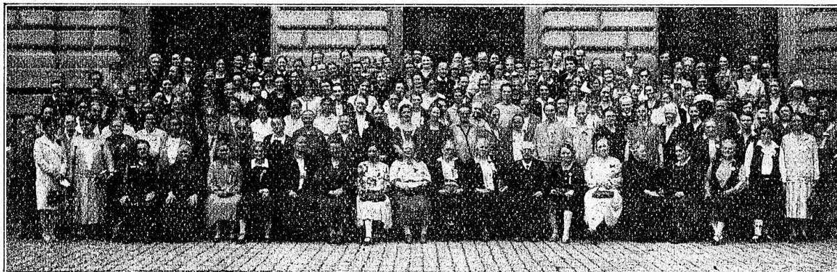
Delegierten-Versammlung des Schweizerischen Hebammenvereins anlässlich der „Saffa“ in Bern 1928.