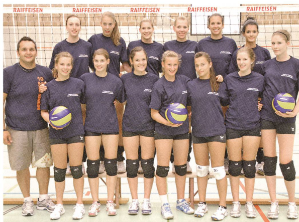
Volleyball Damen 1.