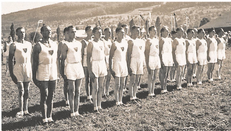
Die Turnfestsieger von 1950 in Reinach.