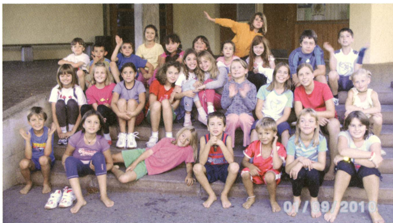
Die «Jugi 2010» vor dem Schulhaus 1957.