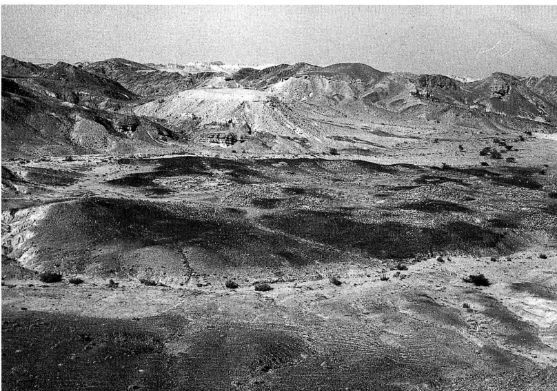
Bild 3: Einer der grössten frühgeschichtlichen Kupferverhüttungsplätze im Nahen Osten ist das im Gebiet von Fenan/Wadi Araba gelegene Khirbet en-Nahas, übersetzt «Die Ruinen des Kupfers». Dieses vermutlich staatlich gelenkte Hüttenrevier ist bereiter Beweis für die Kupferproduktion, die in der Eisenzeit im Vorderen Orient in industriellem Massstab betrieben wurde. Hier wurde das Metall in der Grössenordnung von mehreren tausend Tonnen gewonnen.