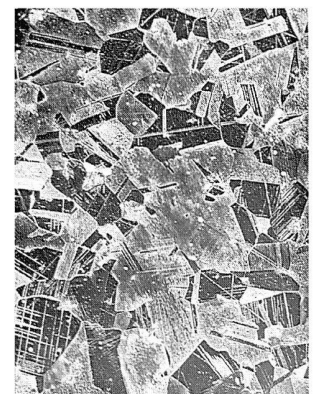
Bild 2b: Mikrogefüge desselben Armreifes. Das Gefüge zeigt, dass die Zinnbronze nach dem Guss geschmiedet und anschliessend nochmals auf mindestens 500 °C erhitzt worden ist, um die endgültige Form zu erreichen. Hierdurch wurde eine Rekristallisation des ursprünglichen Gussgefüges im festen Zustand hervorgerufen. Zu erkennen sind kleine Einschlüsse von Kupfersulfid, die auf eine Herstellung der Bronze aus sulfidischen Erzen deutet. Massstab: 0,1 mm. Auflicht, geätzt mit Eisenchlorid.