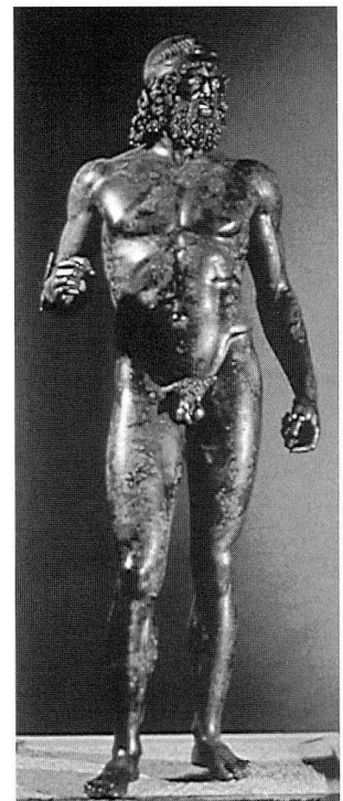
Bild 4: Im ersten Jahrtausend entwickelte sich die Bronze-metallurgie zur Hochblüte. Das hohe technische Know-how, insbesondere der Gusstechnik, fand seinen Niederschlag vor allem in der Herstellung zahlreicher Grossstatuen, wie sie etwa aus der Antike im Mittelmeerraum bekannt sind. Als Beispiel hierfür sei einer der Krieger von Riace gezeigt, eine griechische Grossbronze-statue aus dem 5. Jahrhundert v. Chr. Sie wurde an der Kalabrischen Küste gefunden und ist heute in Florenz ausgestellt.

Eisen dagegen konnte mit den damals zur Verfügung stehenden technischen Möglichkeiten in der Alten Welt nicht als flüssiges Metall, sondern nur im festen Zustand dargestellt werden. Die erforderliche Weiterverarbeitung in der Schmiede bis zum fertigen Artefakt war kompliziert. Da erst die kontrollierte Herstellung von Stahl einen Werkstoff hervorbrachte, welcher der Bronze wirklich überlegen war, dauerte es bis zur Zeitenwende, bis sich dieses Metall endgültig als Werkstoff des täglichen Lebens durchsetzen konnte. ■