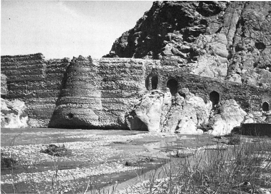
Abb. 3: Schwergewichtsmauer bei Saveh, Iran.

Prüfung), 4 die mittelalterliche Schwergewichtsmauer von Saveh (Abb. 3) 2 und die Kebar-Bogenmauer (Abb. 4) 2 beschreiben nur noch die Entwicklung der Technologie in der Geschichte.