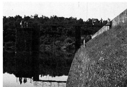
Abb. 2: Einlauffturm der römischen Talsperre Cornalvo bei Merida, Spanien.