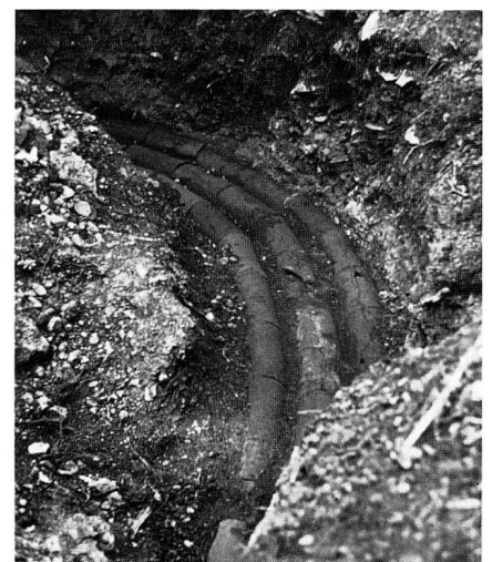
Abb. 5: Madradag-Leitung Pergamons.