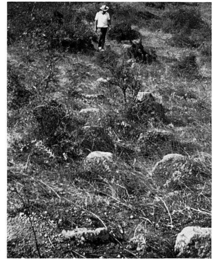
Abb. 7: Auflagersteine der bleiernen Druckrohrleitung Pergamons heute im Gelände.