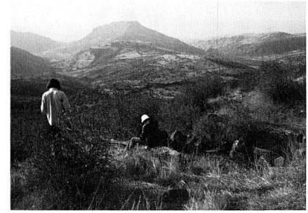
Abb. 6: Blick vom Einlaufbecken der pergamenischen Druckrohrleitung auf den Burgberg.