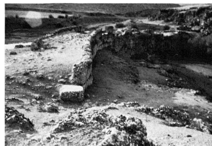
Abb. 1: Römische Talsperrenmauer von Aezani, Türkei.