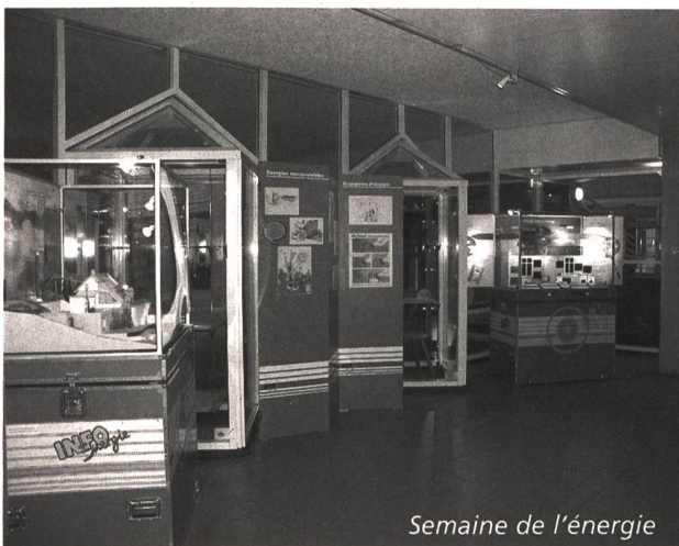
Semaine de l'énergie

L'enthousiasme des enfants qui ont eu la chance de participer récemment aux «semaines de l'énergie» dans les écoles de Crissier, renforce l'opinion que ce chemin en vaut la peine et que cette petite pierre, apportée à l'édifice, contribuera à construire un monde meilleur et durable pour nos enfants.