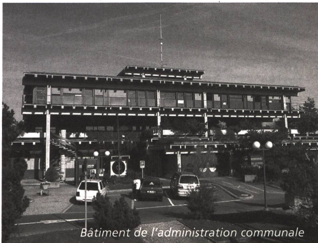
Bâtiment de l'administration communale

Le 18 octobre 2001, la commune de Crissier a reçu officiellement le 60 e Label Cité de l'énergie ® des mains du directeur suppléant de l'Office fédéral de l'énergie H.-L. Schmid et de l'Association responsable du label. Cette distinction récompense le travail intensif de Crissier dans différents secteurs énergétiques et le catalogue de mesures correspondant à cette nouvelle politique.