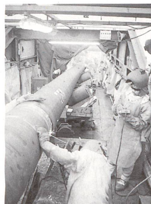
Construction de gazoduc.

La concession est assortie d'une charge; durant les 50 ans de sa validité, la SA Transitgas doit faire en sorte de disposer des capacités nécessaires pour couvrir les besoins en gaz actuels et prévisibles de la Suisse. Cet engagement est une contrepartie au fait