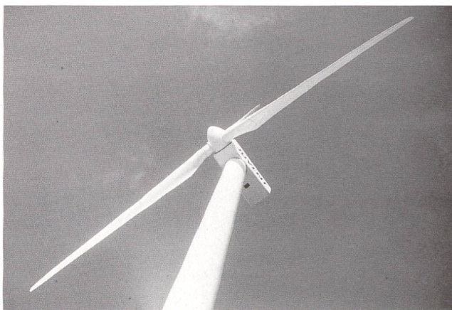
Au Mont-Crosin, les éoliennes ont fait leur preuve.

Avec une puissance totale de 2.145 MW, les résultats sont légèrement inférieurs aux prévisions. Les terrains complexes, la turbulence des vents et le givre sont autant de problèmes spécifiques plus contraignants que les conditions des installations situées sur les côtes européennes.