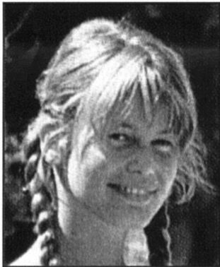
La top model Claudia Schiffer avec ses mensurations peu communes fait rêver les fous de notre époque.