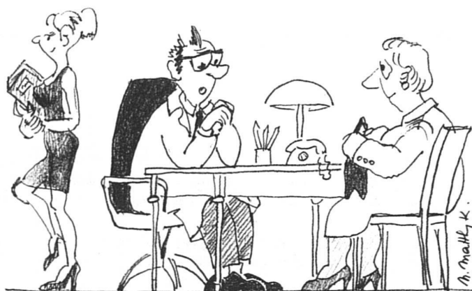
Quelques kilos de trop peuvent rendre les femmes si séduisantes...

Que faut-il en penser? Plusieurs hypothèses se présentent. La doxa féministe nous dicterait évidemment