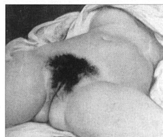
G. Courbet « L'origine du monde », 1866