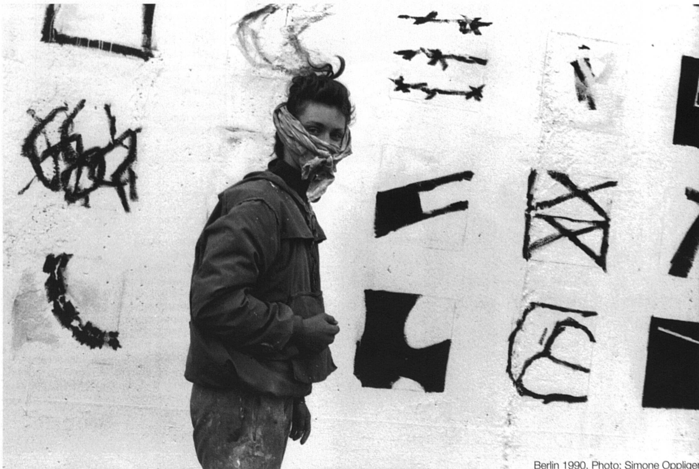
Berlin 1990.

«C'est à Berlin, quelques semaines après la chute du Mur. Une jeune femme peint. (Elle porte un bandeau à cause de la peinture). Une femme créatrice, c'est forcément une féministe. Créer, c'est avoir son point de vue sur les choses, c'est s'affirmer. Créer, c'est la plus belle façon d'être féministe.»