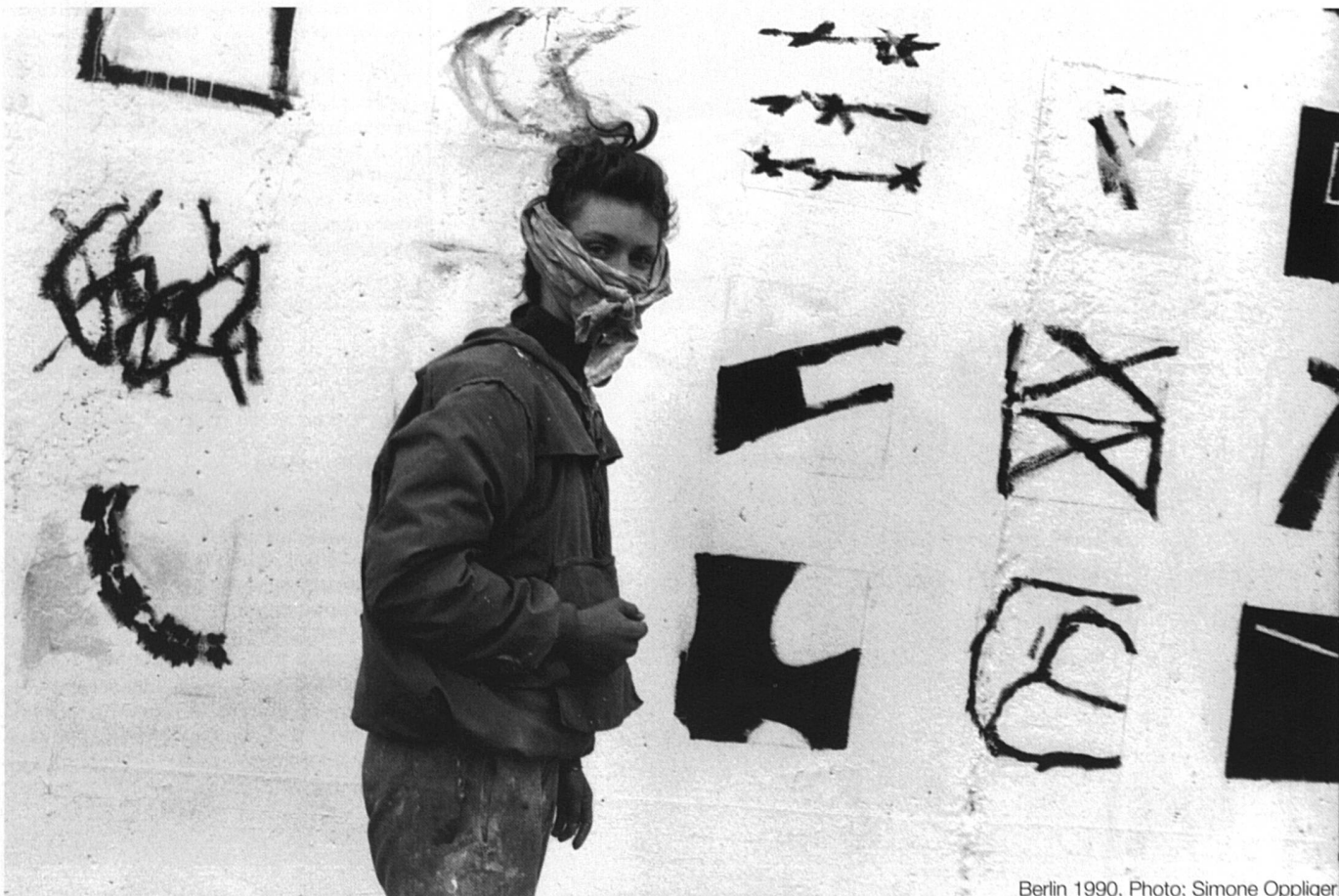
Berlin 1990.

«C'est à Berlin, quelques semaines après la chute du Mur. Une jeune femme peint. (Elle porte un bandeau à cause de la peinture). Une femme créatrice, c'est forcément une féministe. Créer, c'est avoir son point de vue sur les choses, c'est s'affirmer. Créer, c'est la plus belle façon d'être féministe.»