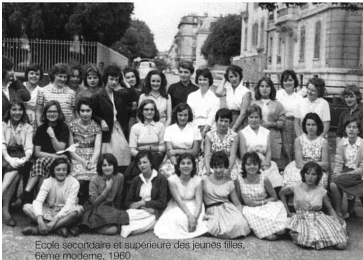
Ecole secondaire et supérieure des jeunes filles, 6ème moderne, 1960

L'escalier qui mène du rez au premier montre l'institutionnalisation de l'éducation des filles qui passe du privé aux mains de l'Etat avec la création, en 1847, de l'Ecole supérieure des jeunes filles et de l'Ecole professionnelle et ménagère en 1897.