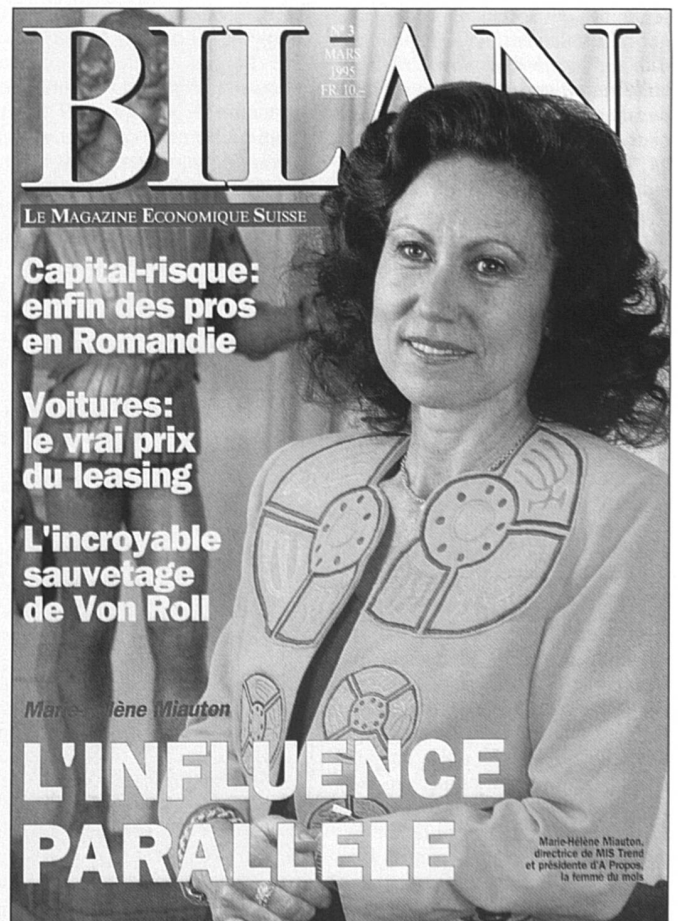
Certaines femmes font la couverture des journaux...

Deux entreprises, éphémères par définition, conçues pour la promotion des femmes, ont été de complets succès, même au point de vue financier: deux expositions