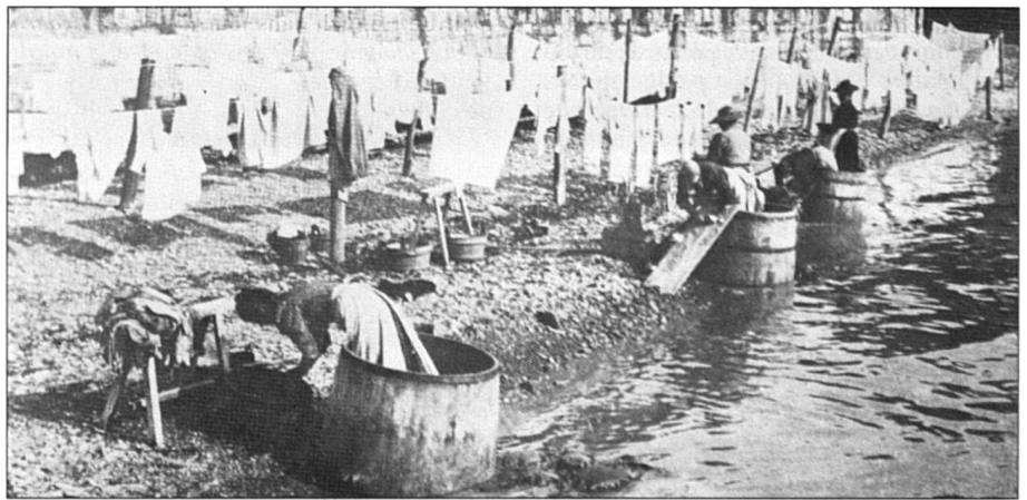
La lessive sur les grèves du lac.

place: dévouement et effort de la femme, propreté du linge, discipline du repassage, entretien soigneux du raccommodage; ordre des piles de linge dans les armoires (compté, numéroté, attaché, enrubanné). Le