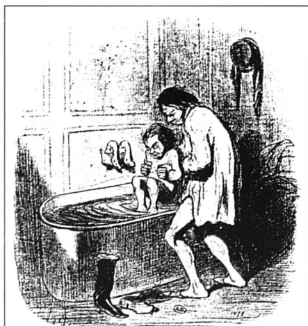
La crainte de l'immersion vue par Daumier. Enfantillages "J'veux pas entrer dans tant d'eau que ça... y doit y avoir de gros poissons." Bibl. Arts Déco. coll. Maciet 356.2.

Au XIX e siècle, un esprit nouveau commence à se manifester avec les progrès de la médecine et de la chimie, ainsi qu'avec l'ascension des préoccupations moralistes. Une politique sanitaire se met ainsi en place, qui vise à réhabiliter les vertus de l'eau et les bienfaits de l'hygiène, tout en élevant le seuil moral des classes populaires se complaisant dans leur crasse et leur vice... «La propreté corporelle qui se veut une inébranlable garantie de l'ordre familial devient le fondement de l'ordre moral et de l'ordre social; c'est elle qui crée l'idée et l'habitude de la décence, de