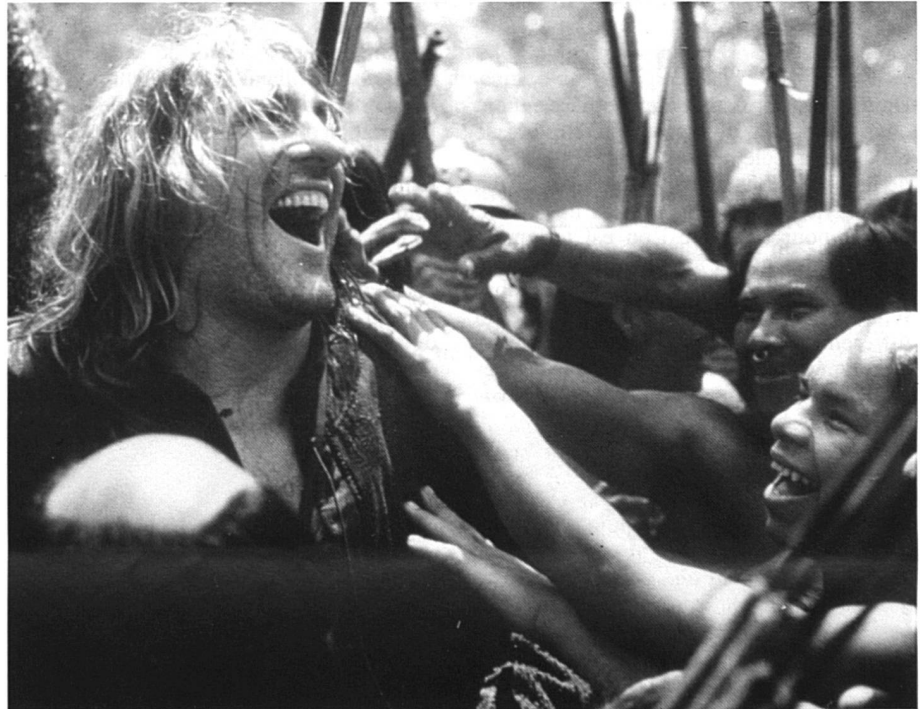
Un aventurier comme ceux que la jeunesse aime...

Quelle belle histoire que la découverte d'un nouveau continent, projet fou d'un aventurier italien émigré en Espagne après avoir passé par la France; projet soutenu par la reine Isabelle de