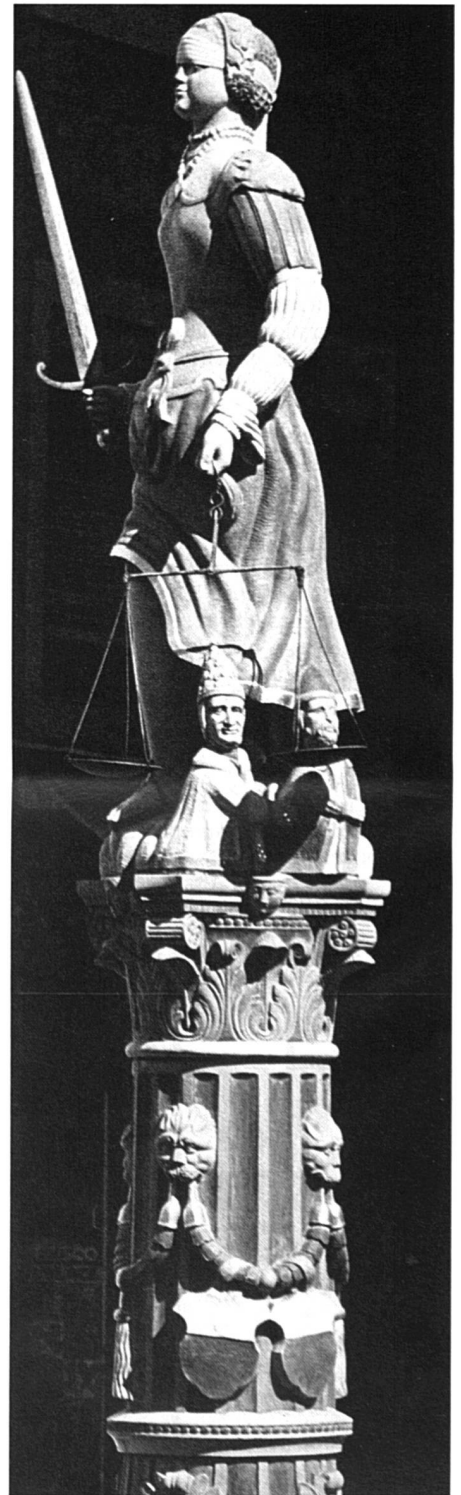
Plus de justice dans le partage des créances.

Le rapport fait plusieurs fois référence aux droits du parent non gardien, notamment à son droit de visite, mais il ne propose rien pour encourager l'exercice concret de ce droit. Ce droit apparaît comme dénué de tout devoir, ce qui correspond à la conception traditionnelle en la matière. Or, il me semble que nous devrions innover sur ce point, pour deux raisons: d'une part, il