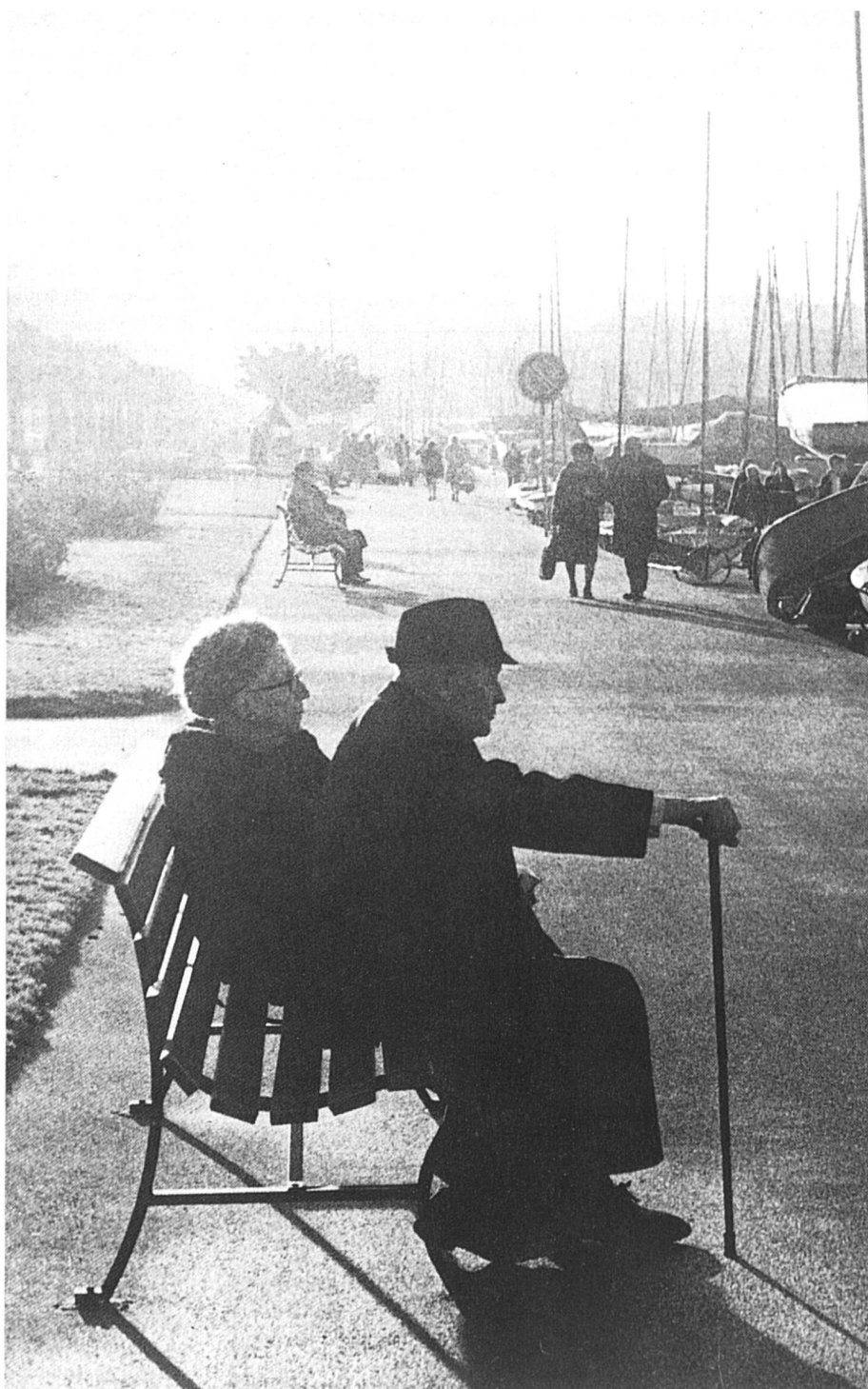
Toutes et tous devraient avoir droit à une retraite digne de ce nom.

Les prestations sont versées aux rentiers AVS selon les cotisations qu'ils ont payées au cours de leur vie active, la rente maximale pouvant atteindre le double de la rente minimale. Employeurs et pouvoirs publics participent solidairement au financement. Le premier pilier est indépendant de l'inflation et ne dépend que de la démographie. La pyramide des âges s'inverse