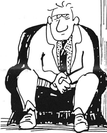
Comme le travail bénévole : ça ne s'achète pas...

– les deux premiers cherchent à connaître la nature et la quantité de travail bénévole effectué l'année passée ;