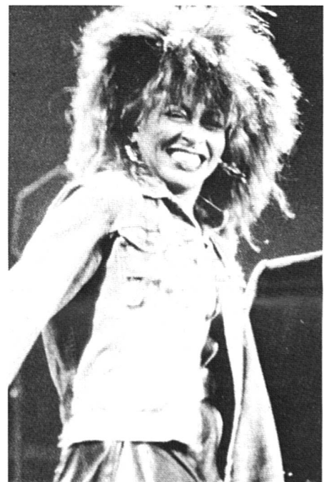
Tina Turner, ou la cinquantaine réussie!