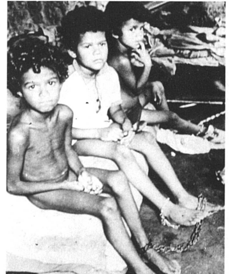
Enfants enchaînés dans un orphelinat au Brésil.

RB — En 1985, on estimait qu'il y avait 10 millions de prostituées en Amérique latine et Hugo d'Ans dénonçait dans son livre l'esclavage sexuel des enfants en ces termes : « Dans les zones de prostitution contrôlées par la police on rencontre fréquemment des mineures avec de faux certificats de naissance... Il arrive même que ces enfants soient obligés à des rencontres sexuelles sous peine de mort... Actuellement, la mode est à la prostitution des mineures. » Cela a donc conduit plusieurs organisations à aller voir sur place.