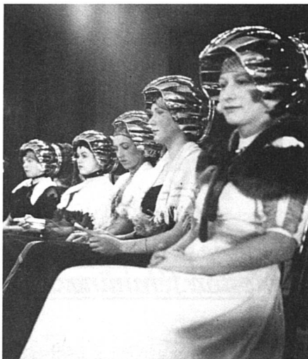
Le sexe ou le genre ? (Photo Paul Senn tirée de «Frauengeschichten», Lemmat Verlag).

Il y a une difficulté pour la Suisse romande que je voudrais signaler. C'est le problème de la terminologie. Nos chercheuses, qui s'inspirent des travaux faits ailleurs, empruntent leur vocabulaire volontiers à l'allemand ou à l'anglais, même parfois dans ses variétés américaines ou canadiennes.