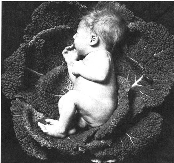
Quand les bébés naissent dans les choux : c'était le bon temps...

A fin juillet 87, on comptait en Suisse 44 bébés nés in vitro et du transfert d'embryons. L'insémination artificielle se pratique depuis une vingtaine d'années; près de 1 % des cas comportent une insémination hétérologue (avec donneur anonyme), mais les techniques de fécondation artificielle ne sont pour le moment soumises qu'aux recommandations de l'Académie suisse des Sciences Médicales et à quelques législations cantonales. L'initiative du Beobachter demandant une législation fédérale a été déposée au printemps; la Suisse sera bientôt saisie d'une recommandation du Conseil de l'Europe, et la commission d'experts nommée par le Conseil fédéral annonce le dépôt de son rapport pour la fin de l'année. Et déjà le Conseil des Etats a accepté à l'unanimité, le 6 octobre, le principe d'une législation fédérale, à la suite d'une initiative cantonale saint-galloise.