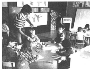
Les hommes veulent reconquérir les petits degrés.

Le calcul est faux, en ce sens que l'enseignement en général ne compte pas trop de femmes mais simplement pas assez d'hommes; on a substitué l'addition à la soustraction, et la nuance est de taille. Le terme même de «féminisation» dénote un état d'esprit alarmant dans le milieu de l'instruction.