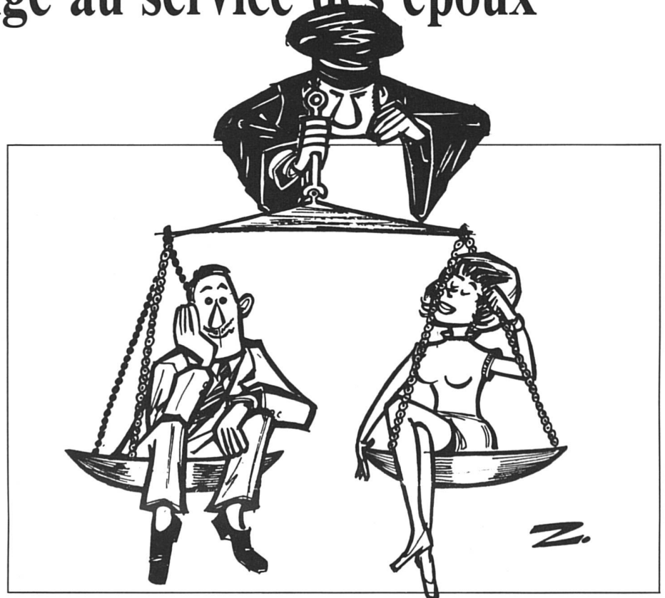
Dessin paru dans Femmes Suisses de janvier 1976, pour illustrer un article sur la future réforme du droit du mariage.

En cas de désaccord entre les époux, le juge pourra également être appelé à fixer la