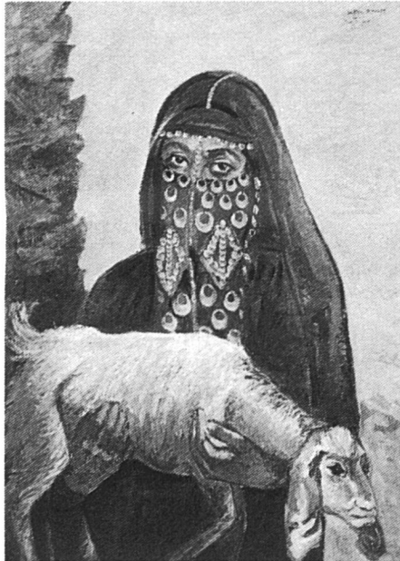
Tableau de Safeya Binzagr, artiste séoudienne installée en Egypte.

Des nombreuses interviews de paysannes de la Haute-Egypte et du Delta, des faubourgs du Caire et d'Alexandrie, il ressort que la femme égyptienne porte sur elle un regard dont le caractère contradictoire ne peut que frapper notre logique occidentale. A la fois, elle constate