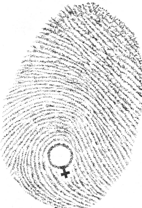
Dessin de couverture de Femmes d'Europe, 15 septembre/15 novembre 1983

« Des travaux sont considérés comme équivalents lorsque deux personnes n'effectuent pas un travail identique mais que,