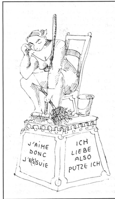
La bonne ménagère

J.A. 1260 Nyon Octobre 1984 N° Envoi non distribués à retourner à Femmes Suisses CP 323, 1227 Car