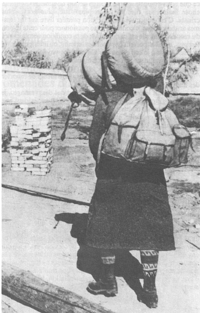
Ella Maillart dans ses pérégrinations à travers le Turkestan russe, 1932.

Le Père Teilhard de Chardin, que j'ai eu la joie de rencontrer souvent, lors de mon séjour à Pékin, m'avait bien dit que je cherchais Dieu... mais ce n'était alors qu'un mot pour moi.