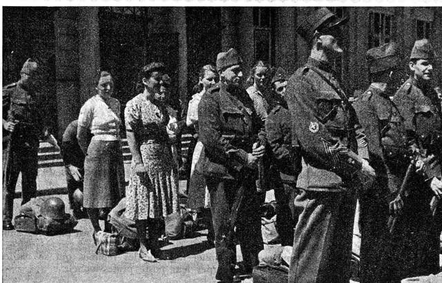
Equipe de cuisinières licenciée en même temps que la troupe en 1940. C'est un document rare : ces SCF n'ont pas encore d'uniforme

Ce cliché a paru dans le « Mouvement féministe » du 14 septembre 1928, en compagnie de deux autres montrant un couple de Suédois d'égale stature (La Suède était un des 19 pays d'Europe où hommes et femmes avaient les mêmes droits politiques) et un couple d'Espagnols, la femme étant de moitié plus petite que son compagnon. Quant à la Suisse, point n'était besoin de commentaires !