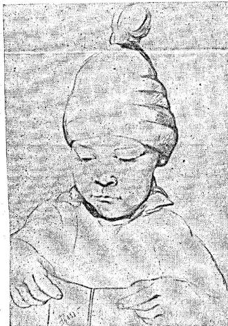
Dessin de Frida Heim