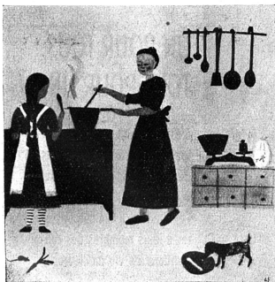
brochure „Du Schweizerfrau“