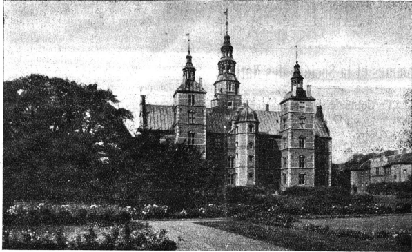
Le château royal de Rosenborg à Copenhague