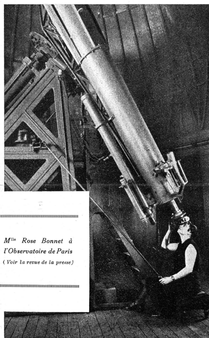
M lle Rose Bonnet à l'Observatoire de Paris (Voir la revue de la presse)