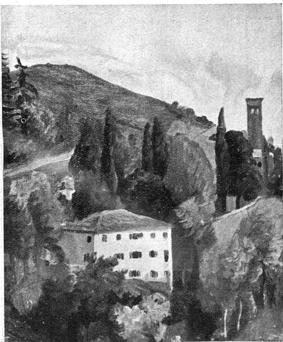
Catalogue de l'Exposition.