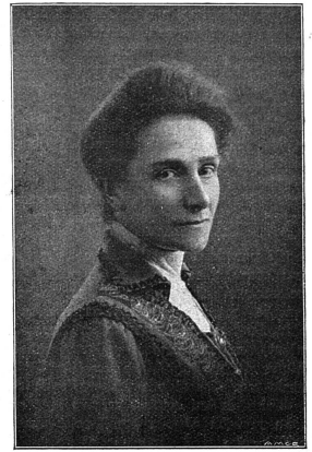
Oliché Mouvement Féministe

Pour en revenir à Louise Labé, elle savait bien ce qu'elle faisait, en invitant les femmes à élever leurs esprits au-dessus de leurs quenouilles.