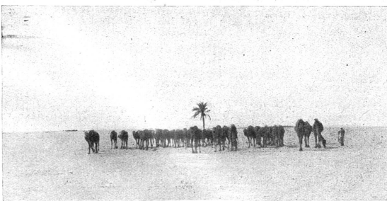
En Afrique du Nord

Soit au total 16 femmes représentant 12 pays. L'an dernier, la Conférence Internationale du Travail comptait 27 femmes représentant 17 pays. Nous ne pensons pas qu'il faille attribuer ce recul à une cause antiféministe, mais bien davantage à la crise, qui a obligé tous les Etats à resserrer leur budget... et nous savons toutes qu'en matière d'économies, ce sont les femmes qui sont les premières frappées! D'autre part, l'an dernier, la question de la revision partielle