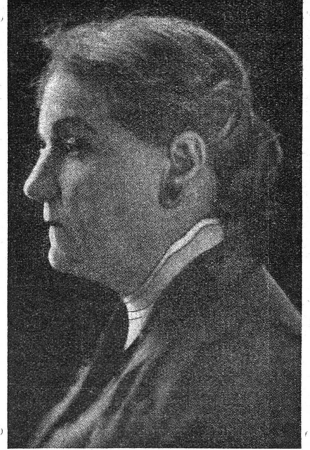
Miss Jane ADAMS