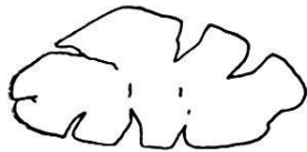
Fig. 17. Grain de glauconie lobé par fissuration. Niveau 31. Gr. 50. Coupe mince M 50.

2. Couleur. Elle est aussi très variable, passant du vert-pâle au vert-olive foncé; elle varie aussi dans un même grain, la couleur vert-pâle se trouvant au centre comme grande tache, soit en petites taches de forme plus ou moins définie. La couleur la plus fréquente est le vert légèrement jaunâtre. La couleur des grains altérés est bien connue, elle passe du jaune ou brun-pâle au brun opaque, suivant l'altération.