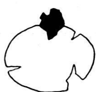
Fig. 19. Grain de glauconie coiffé de pyrite. Niveau 27. Gr. 50. Coupe mince M 48.

7. Rapport de la glauconie avec les minéraux La glauconie épigénise peu de minéraux, il n'y a guère que certaines lamelles de muscovite que l'on peut rapporter à cet état.