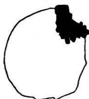
Fig. 20. Grain de glauconie coiffé de pyrite. Gr. 50. Niveau 29. Coupe mince M 49.

La glauconie contient, à l'état d'inclusions, surtout du quartz et de la pyrite, celle-ci très fréquemment. Les inclusions de pyrite ont surtout l'allure de fines granulations, rarement de gros grains. Il existe toute une catégorie de grains où la pyrite se montre d'une façon très constante, on peut qualifier les grains de glauconie dont il s'agit, de grains coiffés de pyrite. Les grains de pyrite constituant le ou les chapeaux sont inclus en partie et plus ou moins profondément dans la glauconie, leur diamètre ne dépasse pas mm. 0,05. Les grains à chapeau de pyrite sont fréquents dans les niveaux 27, 29, 31; on les trouve sporadiquement dans chaque niveau. Le mode de liaison de la pyrite avec la glauconie est variable; dans le cas le plus compliqué, le grain de pyrite semble se prolonger par des languettes dans le grain de glauconie. Dans la grande majorité des cas, le contact de la pyrite et de la glauconie est franc, et ne présente pas d'altération, cependant une légère auréole jaune est visible