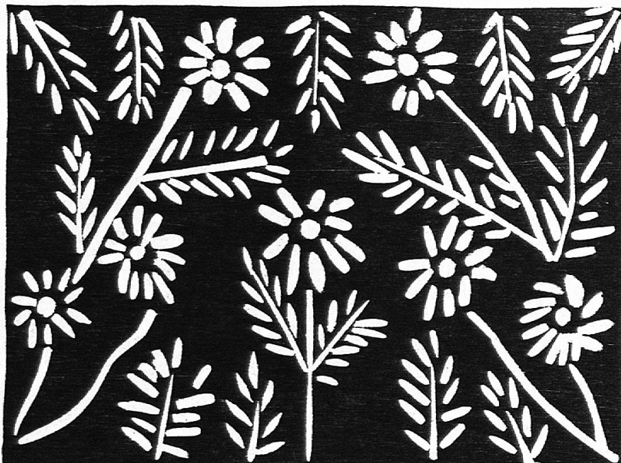
Fig. 1. — Comment les enfants conçoivent la décoration.

Cette façon de concevoir la décoration est si instinctive chez l'enfant que nous avons cherché s'il n'y avait pas une influence du milieu. La cause est facile à constater, surtout à la campagne : c'est l'habitude qu'on a de décorer les ponts de danse, les portes de granges et les salles de fête avec des branches de sapin serrées jusqu'à bien couvrir le bois et agrémentées (horreur !) de roses en papier