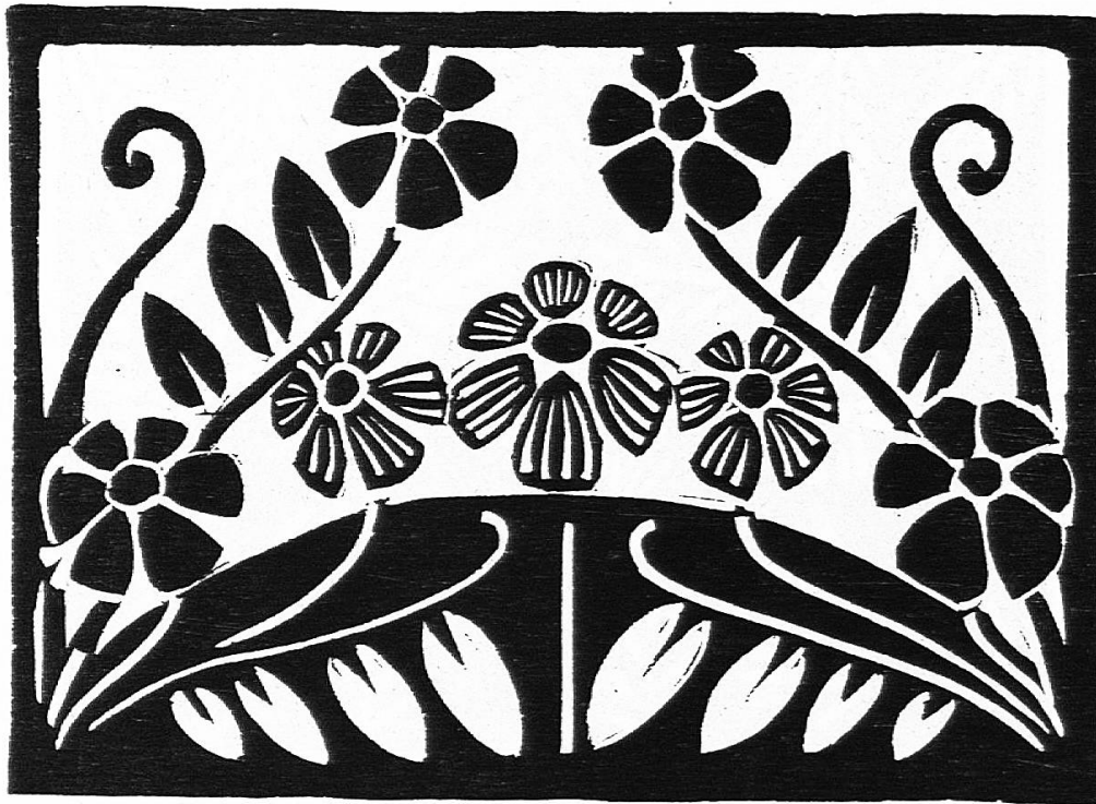
Fig. 2. — La même décoration corrigée.

» Les feuilles sont comme les fleurs : multipliées à l'excès dans cette fausse idée que le fond doit être partout couvert. C'est une erreur. Pour qu'une surface soit bien décorée, elle ne doit pas être décorée partout. Les vides sont utiles parce qu'ils font valoir les parties ornées. Ne gardons que quelques feuilles et rangeons-les suivant une ligne qui renforcera le mouvement des tiges.