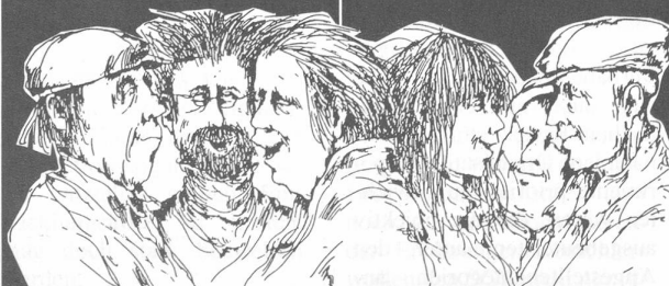
Zeichnung von Gertrude Degenhardt

Schön und aufgestellt natürlich! Der 14. Juni 1991 wird — muss Geschichte machen. Es wird ein Tag sein, an dem Frauen ihre Stärke, ihren Mut, ihren Durchsetzungswillen öffentlich machen. Nach 20 Jahren Frauenstimmrecht, 10 Jahren gleiche Rechte, 10 Jahren versprochene Lohngleichheit zeigen Frauen auf, dass sie zwar einiges erreicht haben, bei weitem aber zu wenig, um sich zufrieden zu geben. Die Gleichstellung in der Familie, in der Ausbildung, in der Arbeit muss endlich Tatsache werden.