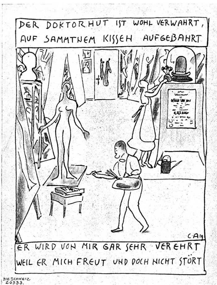
Uno Amiets Dank für die Glückwünsche zum Ehrendoktor.

„Und dort, am Wall, von ferne magst du sie erkennen, die goldige Blüte auf hohem Stiele, es ist die Königskerze. Merke: so