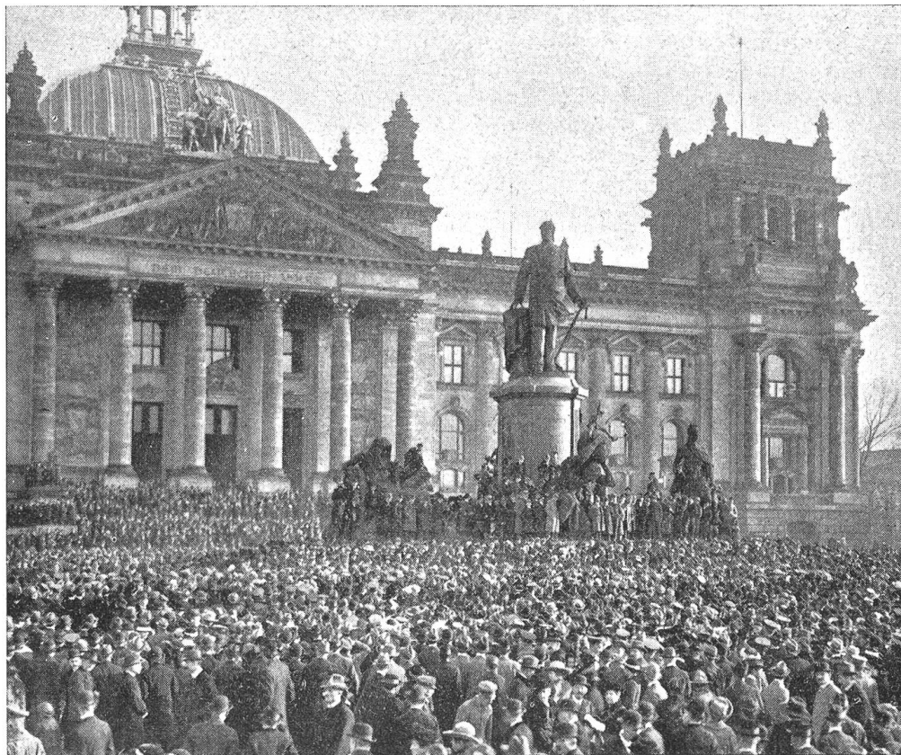
Die Revolution in Berlin. Verkündung der deutschen Republik durch Philipp Scheidemann vor dem Reichstagsgebäude in Berlin. (9. Nov. 1918).

dat, Vogel, wurde dabei getötet, mehrere Demonstranten verletzt. In Bern richtete das sog. Oltenener Aktionskomitee ein Ultimatum an den Bundesrat: es werde den allgemeinen Landesstreik mit Stilllegung des ganzen Eisenbahnbetriebes usw. ankündigen, wenn er nicht sofort die Truppen zurückziehe. Der Bundesrat lehnte dieses Ultimatum ab, bot neue Truppen auf und berief auf Dienstag vor-