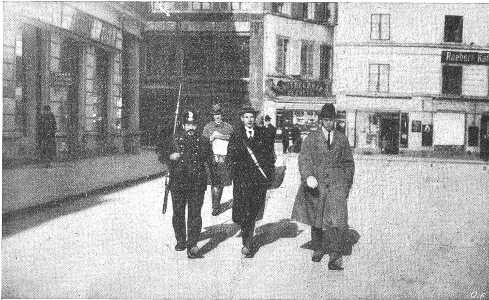
Der Generalstreik in der Schweiz. Studenten als Briefträger, unter dem Schutze des Landsturmmanne.

quartier nach Holland und befindet sich zur Zeit auf Schloß Amerongen, wo nun auch die Kaiserin eingetroffen ist. Der Kronprinz floh ebenfalls über die holländische Grenze und wurde auf der einsamen Insel Wieringen in der Zuidersee interniert. Kronprinz Rupprecht von Bayern flüchtete sich nach Chur. Prinz Heinrich von Preußen, des Kaisers Bruder, hatte die Flucht aus Kiel ergriffen in einem Automobil, an dem er vorsichtshalber die rote Fahne gehißt hatte.