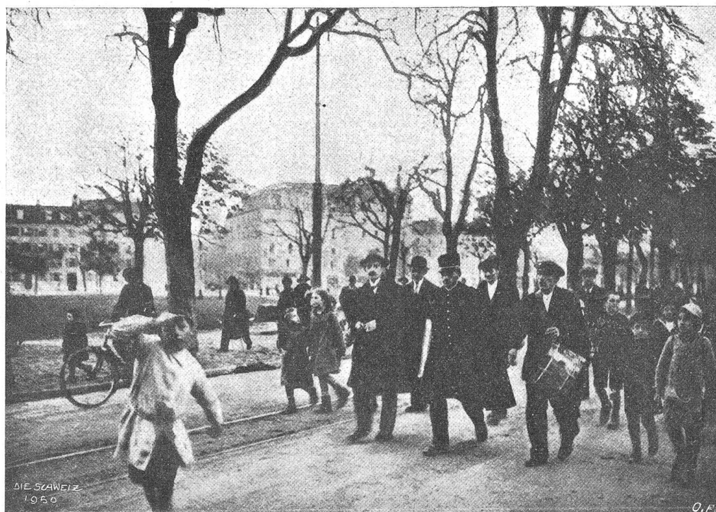
Der Generalstreik in der Schweiz. In Genf wird der Generalmarsch geschlagen zur Mobilisation der Genfer Bataillone.

gierung wandte sich mit ihrem dringlichen Gesuch an Wilson, der die Bitte den alliierten Regierungen unterbreitete. Nachdem sich auch diese bereit erklärt hatten, auf Grund der Wilsonschen Thesen zu unterhandeln, wurde die deutsche Regierung an den Marschall Foch gewiesen, der den Auftrag habe, einer deutschen Abordnung die Bedingungen des Waffenstillstandes mitzuteilen. Die deutsche Abordnung unter Führung Erzbergers fand sich am vorgeschriebenen Orte ein und wurde nach langer Kreuz- und Quersfahrt in den Wald von Compiègne geführt, wo am 8. November die Deutschen die ihnen auferlegten Bedingungen erfuhren. Es wurde ihnen eine Frist von 72 Stunden zur Annahme oder Ablehnung eingeräumt. Die Frist lief am Montag vormittag (11. Nov.) um elf Uhr ab. Die Deutschen mußten alle Bedingungen akzeptieren und ihre vollständige Kapitulation unterzeichnen. Die wichtigsten Bedingungen sind: Sofortige Räumung Belgiens, Frankreichs und Elsaß-Lothringens bis in vierzehn Tagen; Räumung des linken Rheinufer; Uebergabe von Mainz, Koblenz, Köln; auf dem rechten Rheinufer eine 30—40 km tiefe neutrale Zone; Abgabe von 5000 Lokomotiven,