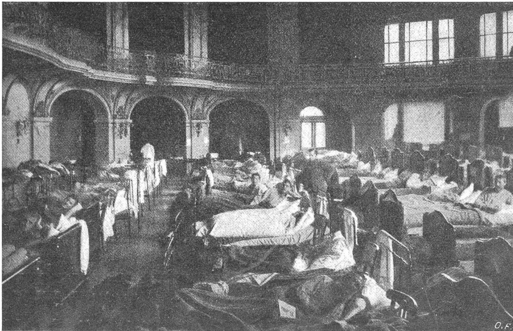
Der Generalstreik in der Schweiz. Der Tonhalle-Pavillon in Zürich als Krankenjaal für grippekrankte Soldaten.

einige verfassungsrechtliche Reformen wie die Uebertragung der Entscheidung über Krieg und Frieden auf die Volksvertretung, die Unterstellung der Militärgewalt unter die Zivilgewalt u. dgl.; aber auch hier hieß es jetzt: Zu spät! Der Sturz kündigte sich am 26. Oktober an durch den Rücktritt Ludendorffs, der bald darauf sich in aller Heimlichkeit nach Schweden in Sicherheit brachte, während der Großadmiral v. Tirpitz nach Winterthur floh. Der Kaiser begab sich von Berlin weg ins große Hauptquartier in den Schutz des populären Hindenburg. Die eigentliche revolutionäre Bewegung flammte am 3. November in Kiel unter den Matrosen auf und sprang von dort sehr bald auf andere deutsche Städte über. In Berlin stellte am 8. November die sozialdemokratische Partei an die Regierung das Ultimatum, daß der Kaiser bis zum folgenden Tage mittags zurückzutreten habe. In der Tat wurde dann am 9. November bekannt, daß Wilhelm II. ebenso wie der Kronprinz auf den deutschen und preussischen Thron Verzicht geleistet hätten. Mit dem Kaiser trat auch der Reichskanzler Prinz Max von Baden zurück, und es bildete sich eine sozialistische Regierung mit dem Abgeordneten Ebert an der Spitze. Der Kaiser flüchtete sich am 10. Nov. aus dem großen Haupt-