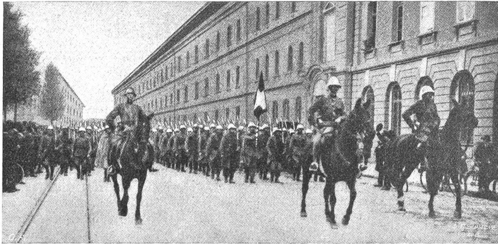
Der Generalstreik in der Schweiz. Ankunft des Militärs in Bern. Phot. Keller, Bern.

von der Schweiz zur „Schweiz“, so wird man es verstehen, wenn wir hier mit einer gewissen Genugtuung konstatieren: Auch die „Schweiz“ hat durchgehalten! Sind für sie schon in gewöhnlichen Zeiten bei ihrem begrenzten Wirkungsgebiet die Existenzbedingungen keine leichten, um wieviel größer mußten die Mühen und Opfer werden unter den drückenden Verhältnissen des Weltkrieges, unter denen in besonderem Maße das Pressewesen zu leiden hatte! Doch wir sind noch da und gedenken auch an dieser Stelle fortzufahren, in dem uns möglichen bescheidenen Umfang und ohne irgendwelche Kampfesstellung nach der einen oder anderen Seite den Lesern einen Ueberblick über die Zeitereignisse zu bieten. Nachdem die „Politische Rundschau“ der letzten Nummer wegen des Landesstreiks und anderer Ursachen hat ausfallen müssen, sind in den nachfolgenden Aufzeichnungen die Begebenheiten der zwei letzten Monate aufzuführen. Bei der nie dagewesenen Fülle und Schwere dieser Ereignisse kann es sich aber nur um eine höchst summarische Zusammenfassung handeln, die auf Vollständigkeit keinerlei Anspruch erhebt und auch auf eine nähere Würdigung des Geschehenen vorerst verzichten muß.